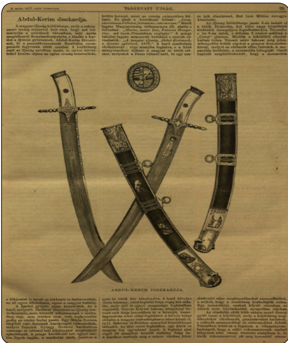
“Abdul-Kerim Diszkardja” Vasárnapi Ujság, 1877 január 14, 24. évf. 2. szám, s. 5-26.

Macar Ünversite Gençliği tarafından Başkumandan Abdülkerim Paşa'ya takdim edilmek amacıyla hazırlanmış tören kılıcı.