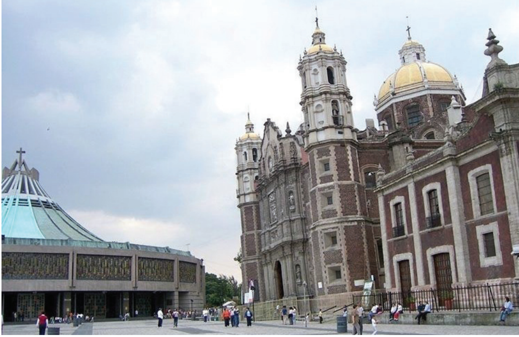
Şekil 3. Meksiko şehrinde bulunan Basilica de Santa Maria de Guadalupe'un yüzey çökmesi dolayısıyla eğilmesi (Google taraması, 2018).

Şekil 3. Tilting of Basilica de Santa Maria de Guadalupe in Mexico city (Google search, 2018).