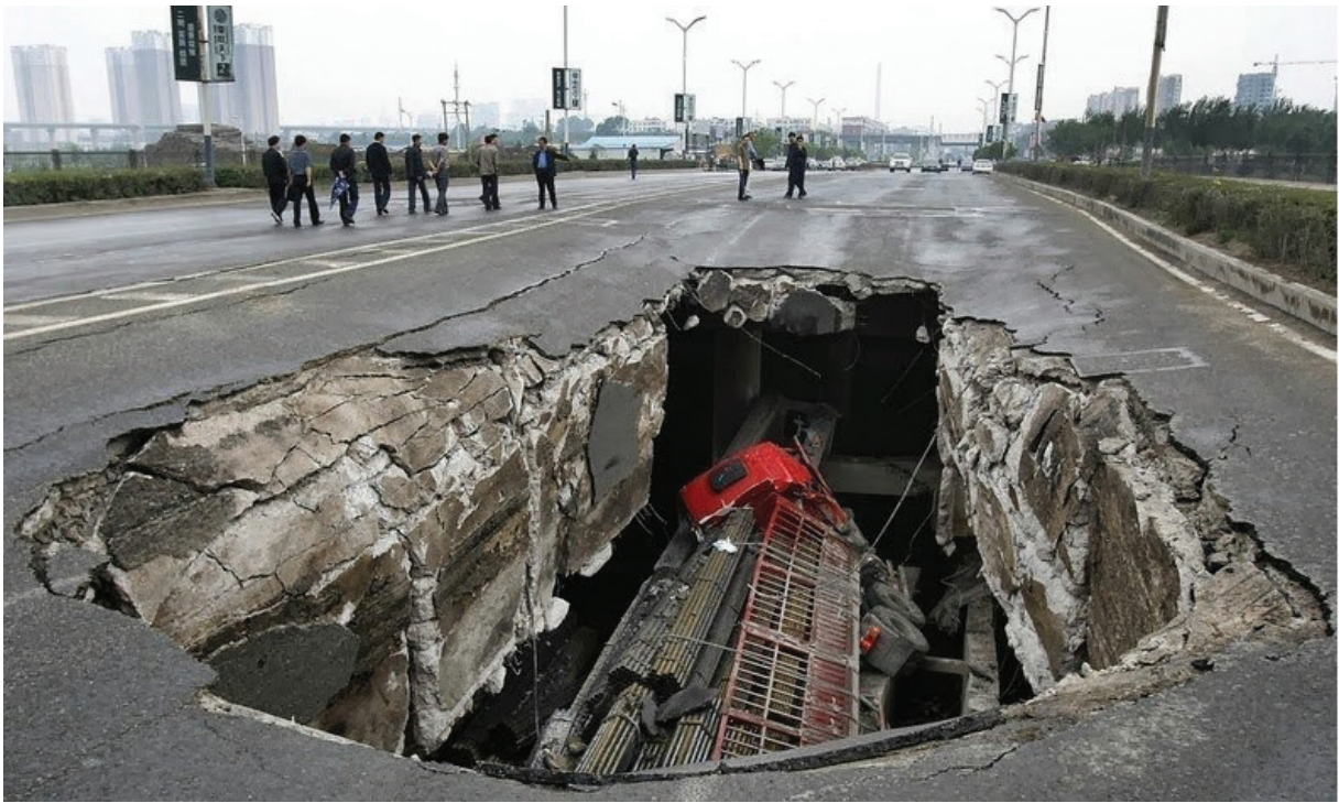
Şekil 4. Chanchun (Çin) şehrinde oluşan yüzey çökmesinin yaptığı hasar (Google taraması).

Figure 4. The damage caused by surface subsidence in Chanchun city, China (Google search).