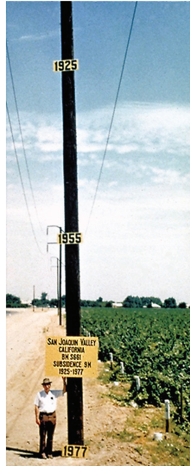
Şekil 5. ABD San Joaquin vadisinde değişik yıllarda ölçülen yüzey çökmesinin geçmişte açılan su kuyusunun çelik borusu yardımı ile tespit edilmesi (Poland, 1984).

tarihsel gelişimi dünyanın değişik bölgelerinden örneklerle aktarmaktadırlar. Diğer taraftan Gambolati ve ekibinin Venedik Lagünü bölgesinde yaptığı modelleme (sonlu elemanlar) çalışmalarının 1974'den 2015'e kadar olan gelişimi anlatılmaktadır.