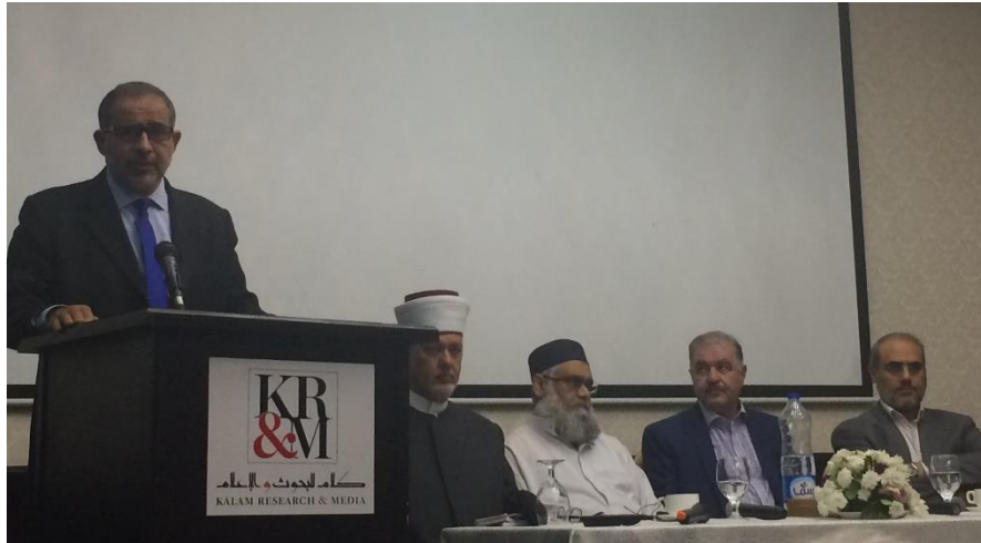
Oturumlardan örnek bir görüntü.