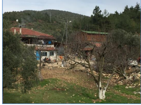
Fotoğraf 3: Bilecik-Gölpazarı Yolu Üzerinde Bulunan Zeytinliboğaz Çiftliği