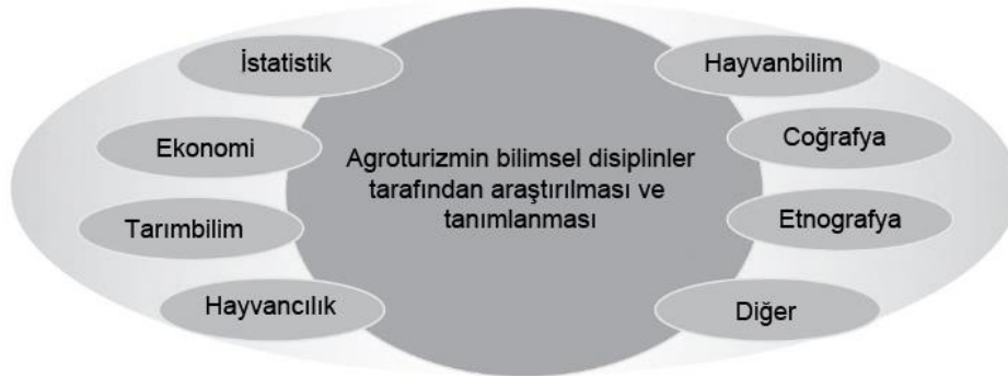
Şekil 1: Agroturizmin Multidisipliner Karakteri

Son yıllarda agro-turizm konusunda hem dünyada hem de Türkiye'de farklı bilim disiplinleri tarafından yapılan çalışmalar artmıştır. İlgili çalışmalar Özşahin ve Kaymaz tarafından ana başlıklar olarak gruplandırılarak özetlenmiştir (Özşahin ve Kaymaz, 2014: 243). Aşağıda verilen şekil bu durumu açıkça ortaya koymaktadır (Şekil 1).