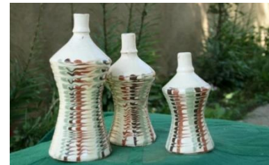
Fotoğraf 1: Kınık Köyü'nden Çömlekçi Ustası Osman Menteş ve Ürettiği Bazı Ürünler.