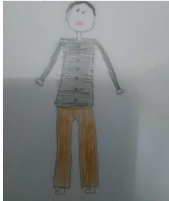
4.sınıflardan Ç17 kodlu 9 yaşında kız çocuk babasını işe giderken çizmeyi tercih etmiştir.