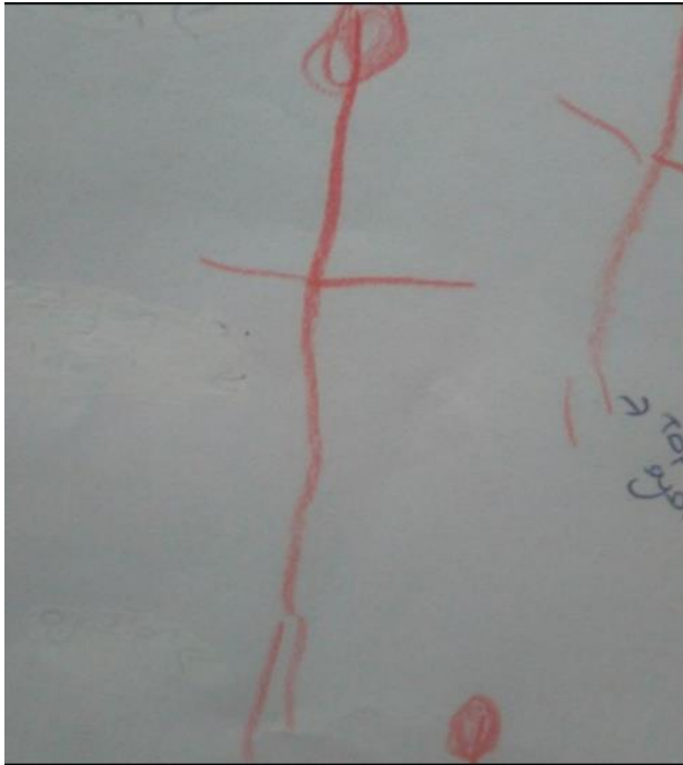
Anasınıfı çocuklarından Ç6 (5 yaşında-kız.) babasını işe giderken çizmiştir.

Çocukların “Baba kimdir?” sorusuna hem anasınıfı hem de 4.sınıf düzeyinde ortak yanıtlardan ortalaması en yüksek verdikleri yanıt " işe gidendir " olmuştur. Bu verdikleri cevap ile ailelerini çizdikleri resimde yaptıkları eylemler örtüşmektedir (Bkz. Resim 1).