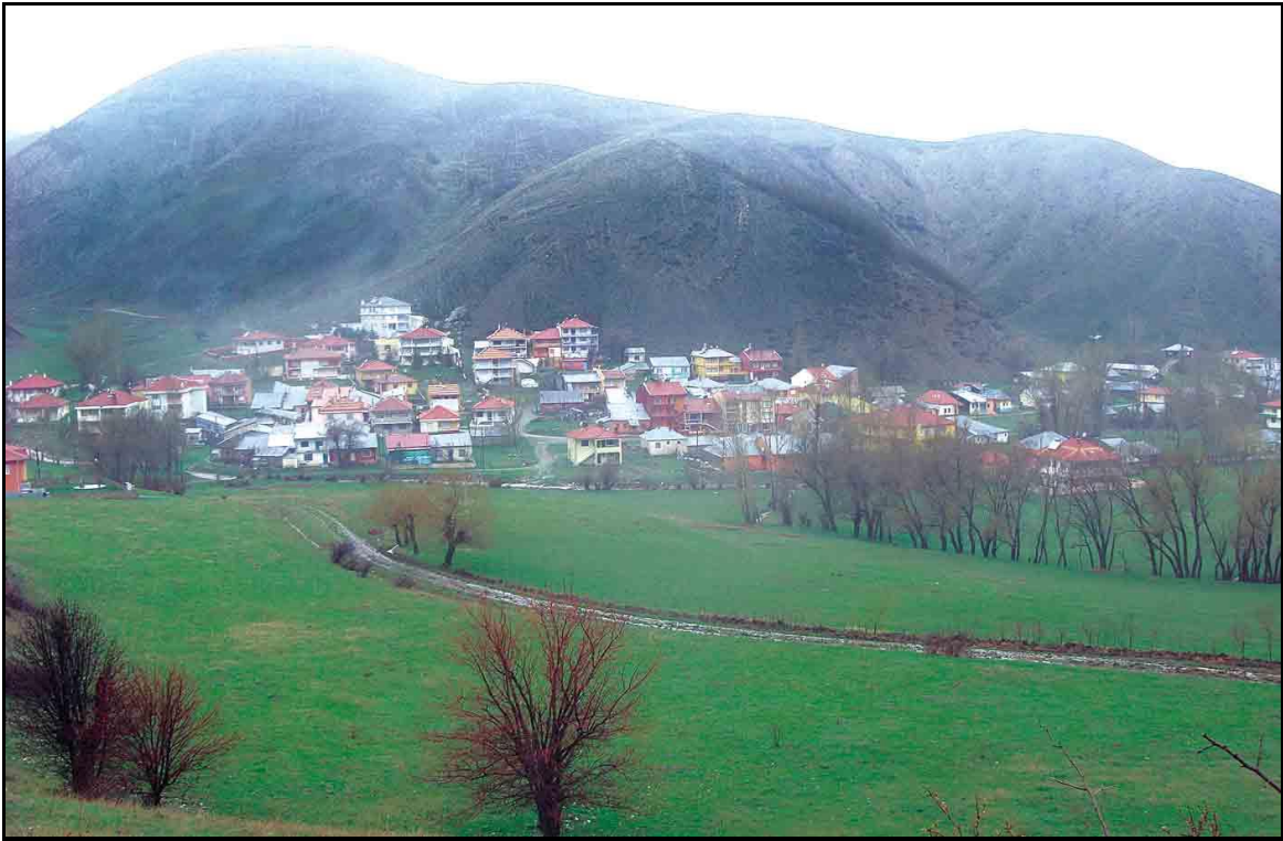
Gümüşhane vilayetine bağlı Kelkit kazasına tabi Akdağ köyünün günümüzdeki manzarası