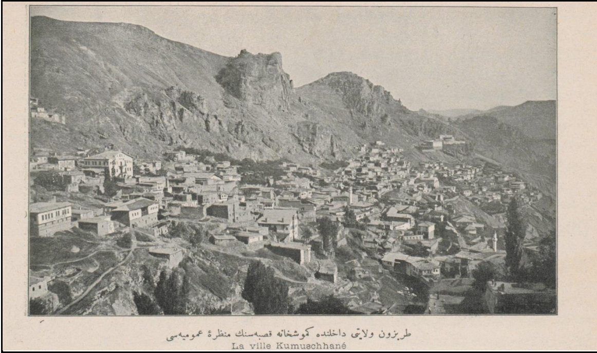
Osmanlı devrinde Trabzon vilayetine bağlı Gümüşhane kasabası (Servet-i Fünûn Mecmuası)