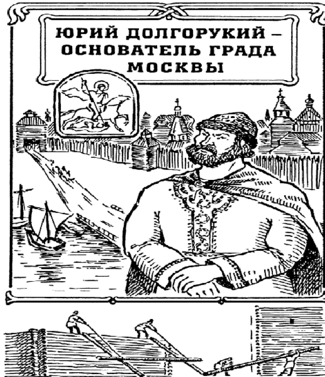
Рисунок No 1. Князь Юрий Долгорукий

рассказывается о насильственной смерти Андрея Боголюбского, сына основателя города Москвы — князя Юрий Владимировича. По сведениям учёного таким источником является рассказ Хроники Константина Манассии «Царство Никифора Фоки» (Шамбинаго, 1936:72-73). ( Рисунок No 1)