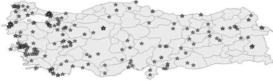
Şekil 1. Türkiye'de Yer Alan Anıtların İller Bazında Konumlarının Harita Üzerinde Gösterimi

Bu araştırmada Türkiye'de yer alan savaş anıtlarının turizm çekicilik kaynakları olarak uygunluğunun belirlenmesinde kullanılan temel veri analizi konumsal analizdir (spatial analysis). Bu amaçla araştırmada uygulanan ilk adım Türkiye'nin siyasi (idari) bölgelerinin haritasının oluşturulmasıdır. Bu amaçla Global Administrative Areas (2018) websitesinden Türkiye'nin siyasi bölgeler haritası temin edilmiştir. Daha sonra T.C. Kültür ve Turizm Bakanlığı Kültür Varlıkları ve Müzeler Genel Müdürlüğü'nden temin edilen anıtların adresleri üzerinden Ek 1'de sunulan enlem (lattice) ve boylam (longitude) bilgileri araştırmacılar tarafından derlenmiştir.