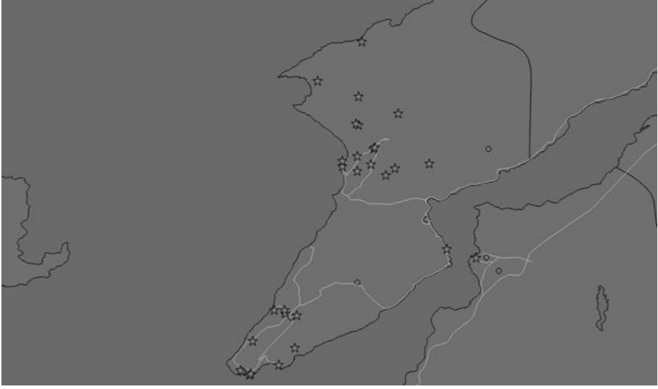
Şekil 4. Çanakkale’de Yer Alan Savaş Alanları Turizmine Yönelik Anıtların Konumlarının Harita Üzerinde Gösterimi

Buradan yola çıkarak Çanakkale ilindeki savaş anıtlarının konumlarının gösterildiği harita Coğrafi Bilgi Sistemleri ile hazırlanmış ve Şekil 4’te sunulmuştur. Çanakkale ilindeki bu anıtlar savaş alanları turizmi kapsamında talebin göz ardı edilmemesi gereken önemli çekicilikler olarak düşünülebilir.