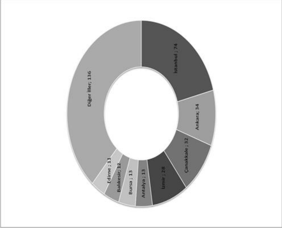
Şekil 2. Türkiye’de Yer Alan Anıtların Frekanslarının İllere Göre Dağılımı

Şekil 2’de Türkiye’de yer alan anıtların frekanslarının illere göre dağılımı sunulmuştur. En fazla anıta sahip ilk dört il sırasıyla İstanbul (74), Ankara (34), Çanakkale (32) ve İzmir’dir (28). İlk dört içerisinde Türkiye’nin en büyük üç ilinin bulunması normal olarak düşünülebilir. Ama ilk dört il içinde Çanakkale’nin üçüncü sırada bulunması savaş alanları turizmi açısından Çanakkale savaş alanlarının önemine güzel bir örnektir.