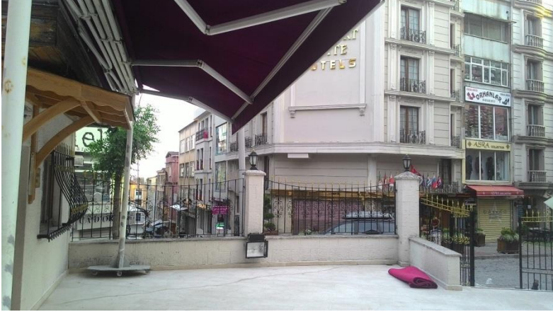
Görsel 1: Cami avlusunun sokağa ve otellere açılan kapısı.