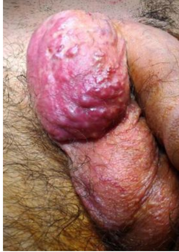
Resim 1: Klinik muayene sırasındaki gözlem

25 yaşında erkek hasta sağ skrotumunda kitle nedeniyle polikliniğimize başvurdu. Yapılan fizik muayenesinde sağ skrotum üst kesimde yaklaşık 6x3 cm boyutunda damarlanması yoğun olan kitle palpe edildi. Bilateral testisler mobil idi (Resim 1). Hastanın anamnezinde travma ve geçirilmiş cerrahi olmadığı tespit edildi. Hastanın çekilen skrotal doppler ultrasonografisinde sağ inguinal kanal distalinden başlayan skrotuma kadar uzanan 65x30 mm boyutunda yoğun kanlanan, hemanjiom lehine görünüm tespit edildi. Hastanın rutin kanları ve koagülasyon profili normal idi. Hastanın tümör markırları negatif idi. Dokunun operasyon esnasında sağ inguinal kanal distal kısmından skrotuma kadar uzandığı ve spermatic kord üzerine yapışık olduğu görüldü.