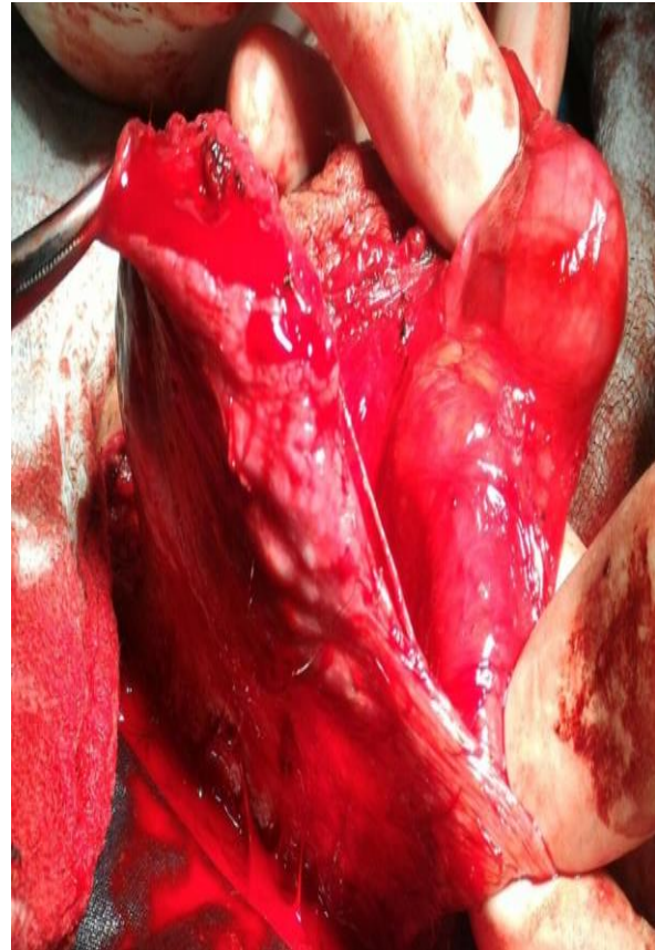
Resim 2: İntraoperatif eksize edilen testiküler kitle