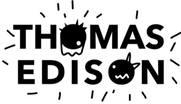
Resim 3. Thomas Edison için tipografik yorum. (Sevgi ARI)