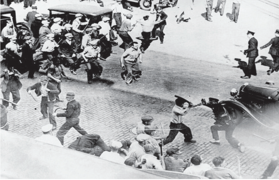
Fotoğraf 1: Sınıf Savaşı; Minneapolis’te İşçiler ve Polis Çatışıyor 3

letler için de; emek nihai hedef hâline geldi. Böylece ‘sermaye için sermaye’ gibi paradoksal bir döngü de oluşabilmiştir. İşçiler ve hak sahipleri arasındaki sınırın ve hangi tarafın nerede kalacağına kararını, emek çatısını kuran iktidar vermiştir. Bu açıdan özellikle aile kurumu modernize edilerek tekrar kullanılmıştır. 1980’lerde bu politikanın İngiltere’de de uygulandığını görüyoruz (Schwarz, 2015). Thatcherizm “yeni emek” söylemi altında bilgi-temelli bir ekonomiyi ve aile-tüketim-emek üçgenini hedeflemiştir.