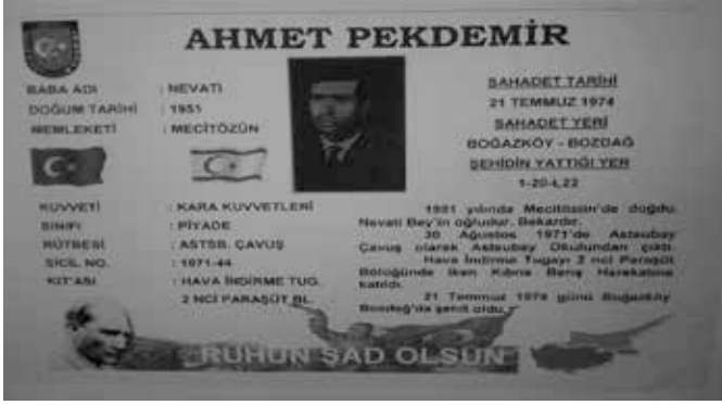
Gazi Musa Budraç'ın Komutanının Şehadetnamesi