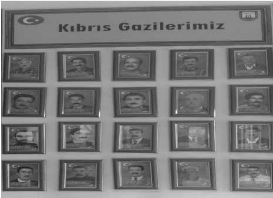
Bingöllü Kıbrıs Gazilerimizden Bir Portre