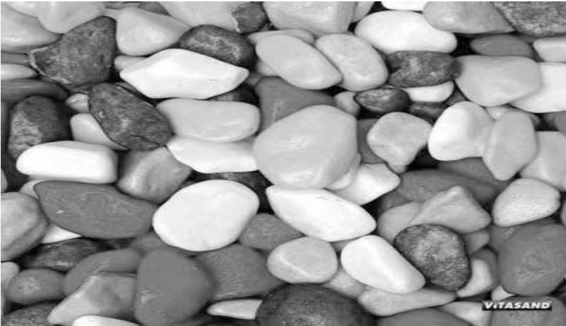
Resim 3: Renkli Taşlar

Bingöl'de çocukları nazardan korumak için uygulanan yöntemlerden bir tanesi de çocuklara renkli taşların takılmasıdır. (K10)