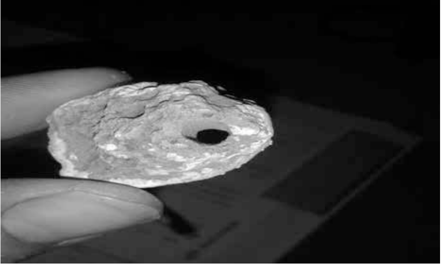
Resim 6: Delikli Taş