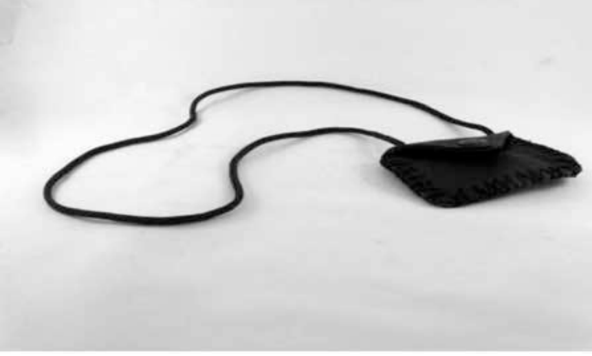
Resim 1: Nazar Muskası