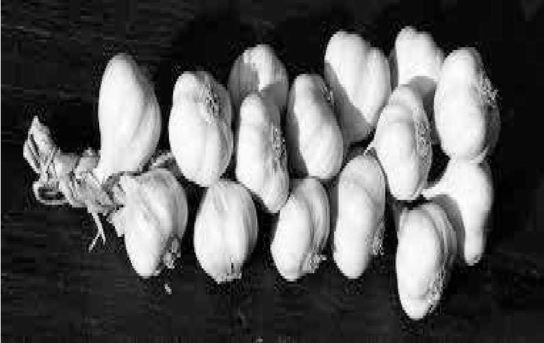
Resim 5: Sarımsak