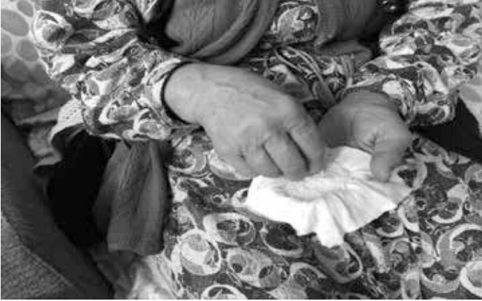
Resim 8: Tuzun Üzerine Ayet Okunması

Tuzun üzerine ayetler okunur. Bu işlem yapılırken bir iğne veya çuvaldız yardımıyla tuz karıştırılır. Ev halkı bir ateş etrafında toplanır. “Nezer puç” (nazar kaybol) denilerek tuz ateşe atılır. (K5) Eve gelip giden herhangi bir kişinin nazarı olduğuna inanılırsa onun nazarına karşı ya o kişi evdeyken ya da evden çıktıktan sonra (genelde çıktıktan sonra) bir tutam tuzu alıp üzerine bazı sureler okuyarak; “Allah’ım sen bizi nazarlardan ve kem gözlerden koru” denilir. Daha sonra bu tuz ateşe atılır. Bu işlem sadece bebek için yapılırsa tuz, bebeğin üzerinden üç defa gezdirilip ateşe atılır. (K1)