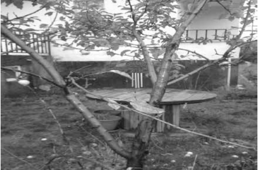
Resim 7: Süs Eşyası Ağacı

Bahçeleri nazardan korumak için ağaçlara değişik süs eşyaları asılır. Bunun sebebi; bahçeye gelen kişinin ilk bakışının bahçeye değil de başka bir noktaya yoğunlaşması içindir. (K10)