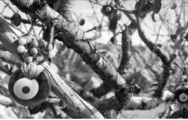
Resim 2: Nazar Boncuğu

takılara ve süs eşyalarına da takılmaktadır. (K8) Nazarlık özellikle çocukların göğüs kısmına takılır ki; nazar eden kişinin dikkati çocuktan ziyade nazarlığa yoğunlaşsın. (K9) Böylece nazarlık, nazarın olumsuz etkisini kırmış olacaktır.