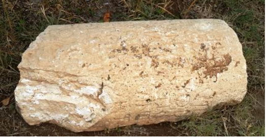
Şekil 1. Selçuk Üniversitesi Mil Taşı Selçuk Üniversitesi Kampüs, Edebiyat Fakültesi