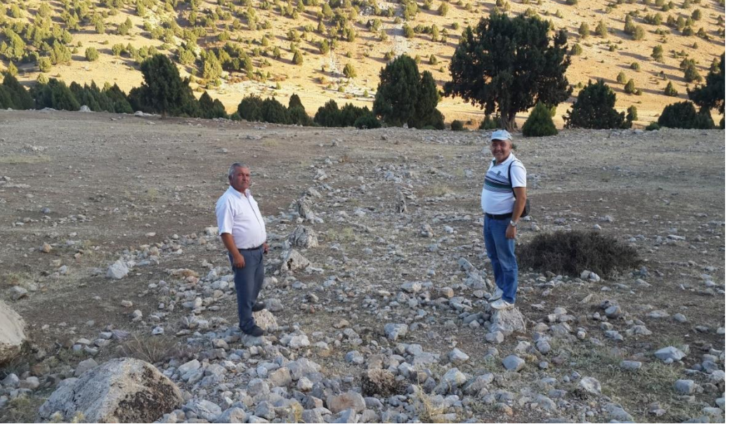
Şekil 2. Düzbel Antik Roma Yolu