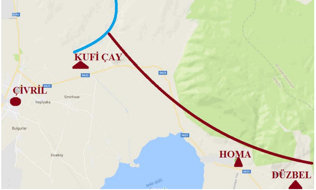
Şekil 3. Niketas Khoniates'e Göre İmparator I. Manuel Komnenos'un İzlediği Yol