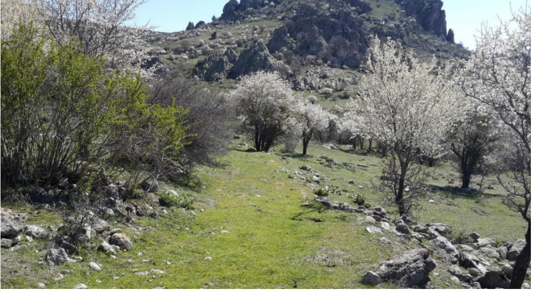
Şekil 6. Balkayalar Antik Yol