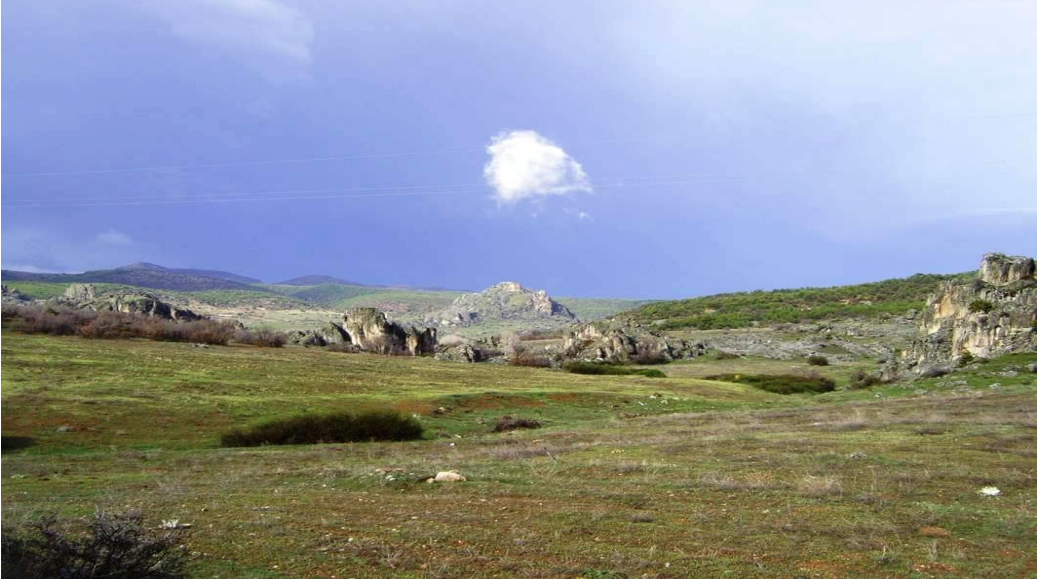
Şekil 5. Balkayalar Kalesi Görünüm