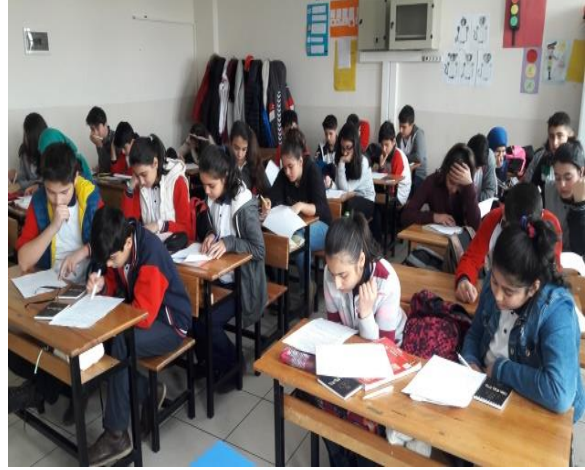
Şekil 1. Anket yapılan okuldan ve anket anından görünüm.

Anketlerin ortalama cevaplama süresi 20-30 dakika arasındadır. Örneklem belirlenmesinde basit tesadüf yöntemi kullanılmış ve rastgele belirlenen 8 sınıfta uygulanmıştır. Buna göre ankete 146 kız öğrenci (%51.8), 136 erkek öğrenci (%48.2)