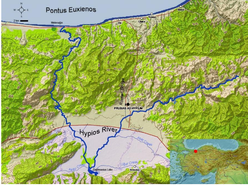
Harita 2: Hypios Nehri ile Pontos Euxeinos bağlantısı.

Prusias ad Hypium halkının en önemli gelir kaynaklarının başında muhtemelen tarım gelmektedir. Kentin territoriumundaki verimli ova ve bol su, tarım, meyvecilik ve hayvancılık için yeterli imkânları sağlamaktadır (Robert, 1980: 41-42). Hypios Nehri ovadaki zirai faaliyetler için gerekli suyu bol miktarda sağlamış olmalıdır (Dörner, 1957: 1128). (Harita 2).