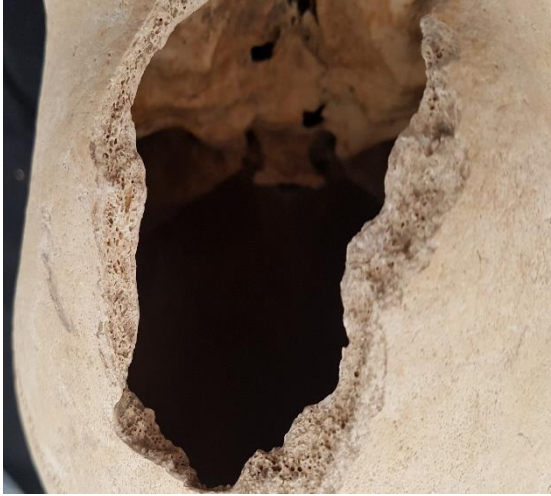
Resim 8: M 35 – 3 Erkek Bireyde Diploede Kalınlaşma