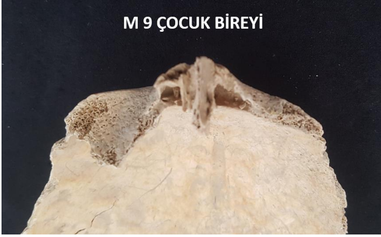
Resim 2: M9 Çocuk bireyinde cribra orbitalia

Porotic hyperostosisin toplum içinde görülme sıklığı ise %13,3 olarak tespit edilmiştir. Spradon toplumunda ayrıca 8 bireyde diploe kalınlaşması saptanmıştır. Toplum içinde diploe kalınlaşmasının görülme sıklığı ise % 8,9'dur. Kadın bireylerden M 23-4 bireyinde Cribra orbitalia, porotic hyperostosis ve diploe kalınlaşmasının her 3'ü de mevcuttur (Resim 3),(Tablo 2)