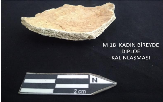
Resim 4: M 18 Kadın bireyde Diploe Kalınlaşması

Porotic hyperostosis'e sahip Spradon kadın birey sayısı da tıpkı cribra orbitalia da olduğu gibi 5'tir. Dolayısıyla kendi cinsiyet grupları düşünüldüğünde toplum genelinde %5,6'lık bir porotic hyperostosis oranına sahip olduğu görülmektedir. Porotic hyperostosisli kadın oranı tüm kadınlar içerisinde %13,2 iken yetişkin Spradon toplumu arasında oranı %7,2'dir. Kadın bireylerde diploe kalınlaşması da mevcuttur. Spradon toplumu kadın bireylerin 7 tanesinde diploe kalınlaşması tespit edilmiştir. Toplum içerisindeki toplam 8 kafatasında görülen kalınlaşmanın 7 tanesi kadın bireylerde tespit edilmiştir. Toplumun genelinde bu oran %7,8 iken yetişkin bireyler arasında %10,1'lik bir oran mevcuttur. Kadın bireyler arasında ise %18,4'tür (Tablo 3). Yani yaklaşık her 5 kadın bireyden 1'inde diploe kalınlaşması mevcuttur (Resim 4)