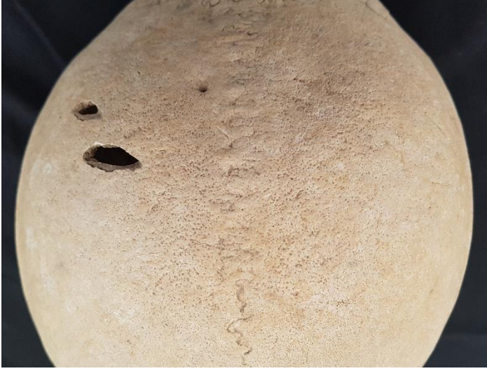
Resim 7: M 35 – 3 Erkek Bireyde Porotic Hyperostosis

Erkek bireylerde kadınlara göre diploe kalınlaşması daha az seviyededir. Sadece 1 bireyde diploe kalınlaşması tespit edilmiştir. Orta Yetişkin M 33-4 erkek bireyde aynı zamanda porotic hyperostosis de mevcuttur (Resim 7,8).