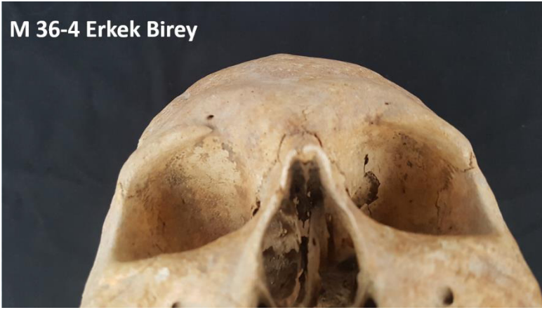
Resim 5: M 36-4 Erkek Bireyinde Cribra Orbitalia

Erkek bireylerdeki porotic hyperostosis sayısı cribra orbitaliaya göre fazladır. 6 erkek bireyde porotic yapı mevcuttur. Bunun erkek bireyler arasındaki oranı %19,4'tür. Kadın bireylerde olduğu gibi yaklaşık her 5 erkek bireyden 1'inde porotic yapı ile karşılaşmaktadır (Resim 6). Yetişkin bireylerde ise porotic yapıyı erkek bireylerin oranı %8,7'dir.