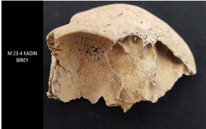
Resim 3: M 23-4 Kadın bireyde Cribra Orbitalia

Porotic hyperostosisin toplum içinde görülme sıklığı ise %13,3 olarak tespit edilmiştir. Spradon toplumunda ayrıca 8 bireyde diploe kalınlaşması saptanmıştır. Toplum içinde diploe kalınlaşmasının görülme sıklığı ise % 8,9'dur. Kadın bireylerden M 23-4 bireyinde Cribra orbitalia, porotic hyperostosis ve diploe kalınlaşmasının her 3'ü de mevcuttur (Resim 3),(Tablo 2)