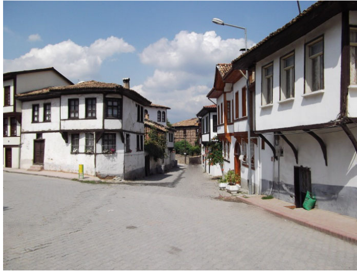
Şekil 3. Geleneksel Osmaneli evleri

Günümüzde ise Osmaneli ilçe merkezinde 200 kadar geleneksel ev bulunmaktadır. Özellikle 17. yüzyılda yörenin başlıca geçim kaynağı olan ipek böcekçiliği ve kozacılık faaliyetlerine göre şekillenmiş bu evler, sahip oldukları mimari özellikleri ile oldukça dikkat çekicidir (Okuyucu, 2011), (Şekil 3).