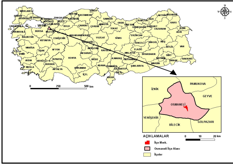
Şekil 1. Osmaneli İlçesi lokasyon haritası

İlçe, merkez ve 27 köy dâhil toplam 526 km 2 'lik bir alana sahiptir. Araştırma konusunun kapsamı ve sınırları nedeniyle bu sahanın tamamı çalışma kapsamında değildir. Araştırmada kültürel mirasın yoğun olduğu Camiicedid, Camikebir mahallelerinde kentsel sit alanı olarak ilan edilen bölgede yoğunlaşmıştır (Şekil 2).