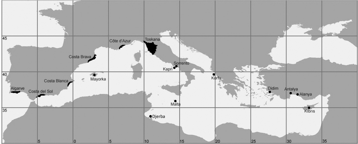
Şekil 2: Yaşlı Avrupalıların Akdeniz kıyılarında göç ettikleri başlıca destinasyonlar. Bu yerler, çok sayıda araştırmaya da konu olmuştur.

Figure 2: Major destinations along the Mediterranean coasts where the elderly Europeans head for.