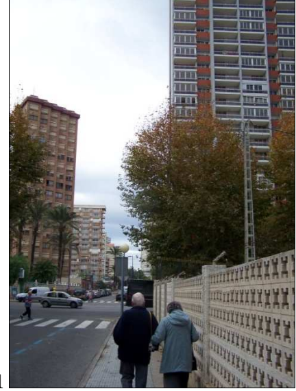
Foto 1 ve 2: İspanya’nın güneyinde bir dağ köyü Mijas (1) ve yoğun yapılaşmış kıyı kuşağı ile dikkati çeken kitle turizm merkezlerinden Benidorm (2).

Photo 1 and 2: Mijas, a Spanish village (1) and Benidorm, a Spanish mass tourism destination (2)