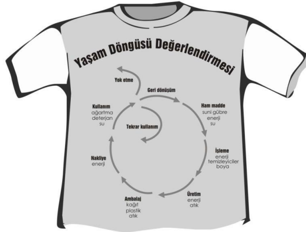
Şekil 2. Bir Tişörtün Yaşam Döngüsü Değerlendirmesi (Balpetek, 2012: 45).

Aşağıdaki Şekil 2’te bir tişört üretimi yaşam döngüsü değerlendirme kapsamında kabaca ele alındığında; hammadde eldesi, hammaddenin işlenip önce iplik sonra kumaş haline getirilmesi bu sırada terbiye işlemlerinden geçirilmesi ardından kesim ve dikimden oluşan imalat, paketleme, nakliye, kullanım ve kullanım ömrü bittiğinde atık-geri dönüşüm-tekrar kullanım olanakları ile yaşam döngüsünü tamamlayacağı görülmektedir(Balpetek, 2012: 45).