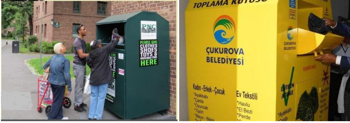
Şekil 4. Atık Giysi Toplama Kutuları(URL 5, 2017).

Şekil 4'te ise, sürdürülebilirlik temelli projelerden kabul edilen atık giysi kutuları görülmektedir.