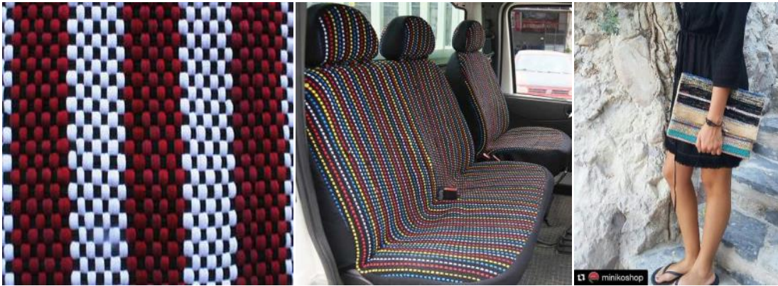
Şekil 3.Chapputzs Markasının Ürünleri (URL 4,2017).

Üretim sırasında oluşan atıkların değerlendirilmesi genellikle atık malzemenin üretim hattına tekrar dâhil edilmesi veya geri dönüşüm işletmelerine satılması ile gerçekleştirilir. Ekolojik eğilimlerin artması ile ortaya çıkmış istisnalardan olan atık ürünlerin tasarımlarda kullanılarak kazanımının sağlanması da alternatifler arasındadır. Şekil 3’te görmüş olduğumuz örnekler, üretim esnasında oluşan atık malzemelerden oluşturulmuş ürünlerin olduğu bir marka olan Chapputz markasına aittir.