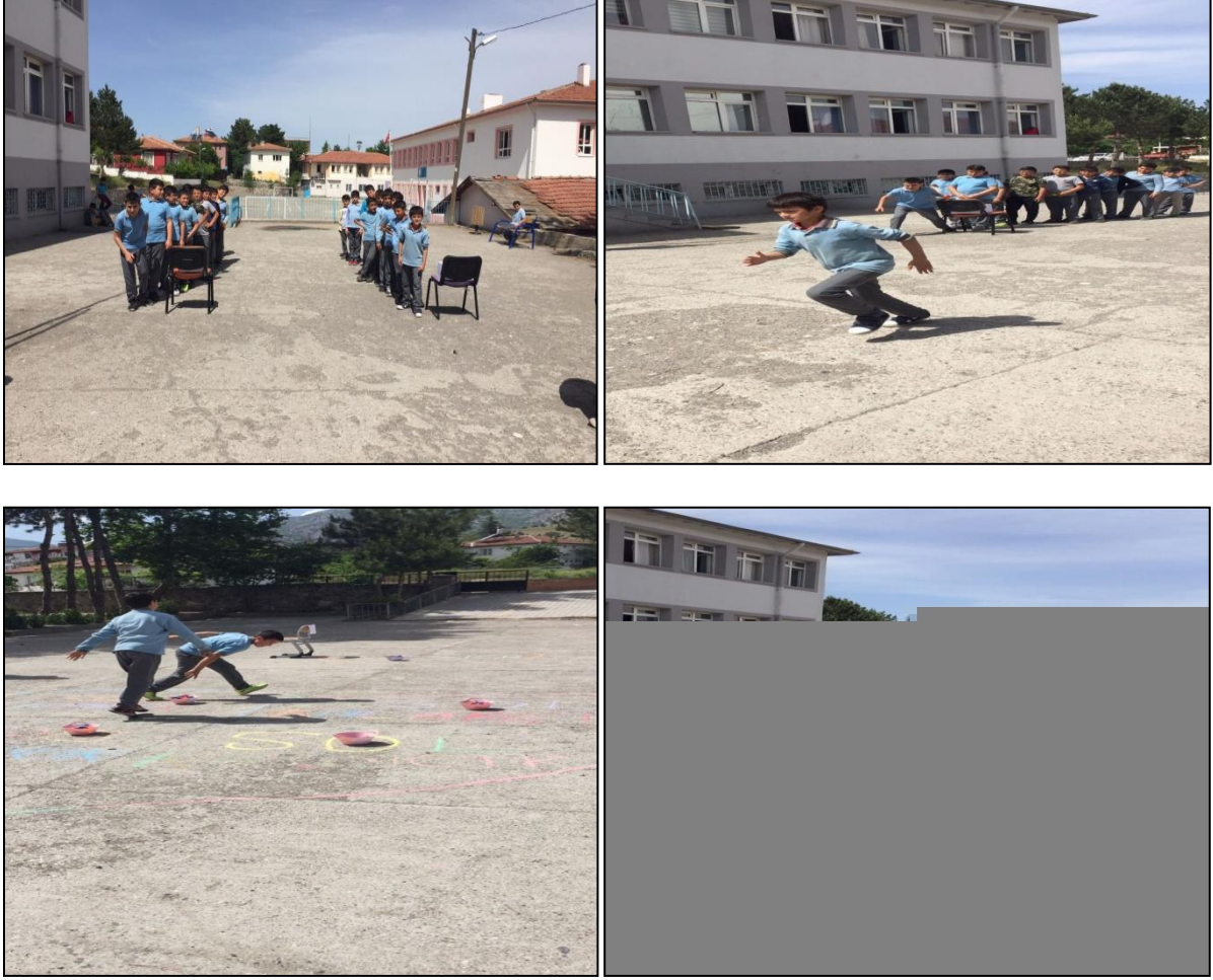
Resim 1. Pilot Uygulamadan Örnekler