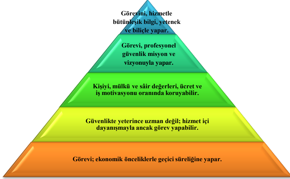
Şekil 2. Özel/Güvenlik Hizmetine Dönük Personel Nitelik Piramidi

Özel güvenlik personel hizmet niteliğine dönük bu piramitten de anlaşılacağı gibi, güvenlik işini yapan her güvenlik personelinin yaptığı göreve/işe olan yaklaşımı ve katkısı aynı değildir. Nitekim özel güvenlik hizmetine yönelik yapılmış çalışmalar ile gündem olan haberler, ağırlıklı olarak mevcut özel güvenlik hizmetinin piramidin ilk üç basamağında konumlanışını resmetmektedir. Ancak, sınırlı oranda şirket, kurum ve özel güvenlik görevlisi dördüncü, hatta beşinci basamakta konumlandırılmayı hak edebilmektedir. Bu piramide göre nitelikli istihdam için öncelenmesi gereken eşik ise üçüncü kategoriden başlatılabilir. Sektörün bu manzarasının, sektörün iç güvenlik hiyerarşisindeki konumuyla olan alakası ise tartışmasızdır.