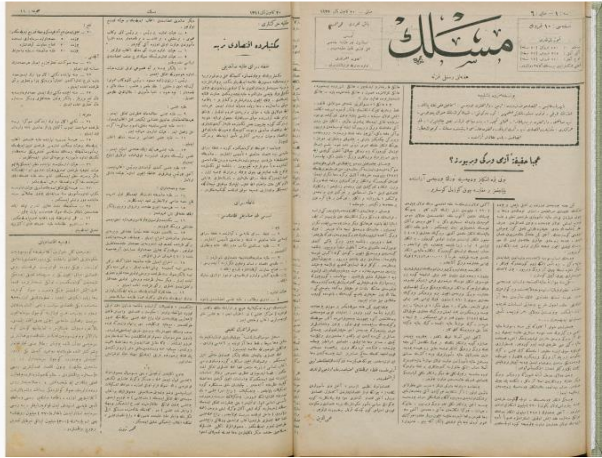
Talebe Sandığı'nın açılışını kutlayan ve nizamnamelerini tam sayfa olarak yayımlayan Meslek gazetesi (Meslek, 20 Kanûn-ı sâni 1341:11).