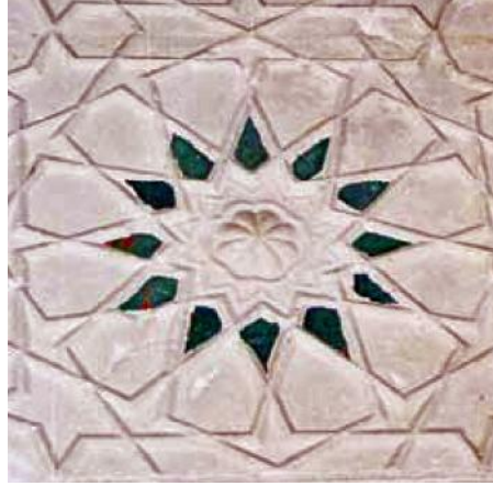
Resim 1a, b, c: Edirne Yıldırım Camii giri eyvanının güneyindeki tabhane mekânında alçı ocak nişinin bordür ve alınlı duvarından firuze sırlı, gömme çiniler.

1877-8 Rus işgalı sırasında önemli ölçüde tahrip olan Yıldırım Külliyesi'nden günümüze sadece cami ile imaretin avlu duvarına biten iki ocak kısmı ulaşabilmiştir. Cami "Ters T" planlı olup, harimdeki kare planlı merkez mekân kubbeye örtülüdür. Merkez mekânı oluşturan karenin dört kenarında beşgen tonozla örtülü dört eyvan sıralanmaktadır. Duvarındaki giriş eyvanının iki yanında yer alan tabhane odaları ise kubbelidir. Caminin tek minaresi güneydoğuya köşede yer alır. Cami 18. yüzyılda geçirdiği onarımdan sonra 2006 yılında büyük bir restorasyondan geçirilerek yeniden ibadete ve ziyarete açılmıştır.