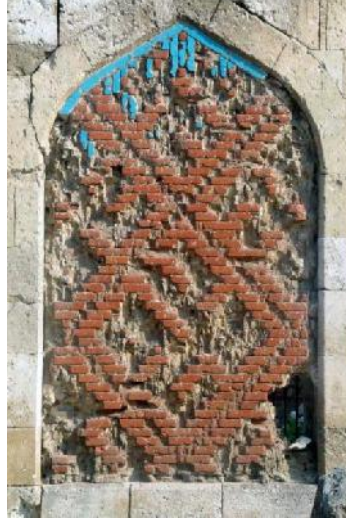
Resim 11: Beylerbeyi Sinanüddin Yusuf Türbesi güney dış cephesinden sivri kemerli niş içinde sırlı tuğla kompozisyonu.

Bugün hiçbir iz kalmamış olmasına rağmen, Mezid Bey Camii'nin minaresinin de yapıldığı dönemde yeşil renkli çinilerle kaplı olduğu, bu nedenle halk arasında “Yeşil Cami” adıyla da anıldığı kaynaklarda belirtilmektedir. 20 Cami 1442 tarihinde Alacahisar Sancak Beyi Mezid Bey tarafından yaptırılmıştır.