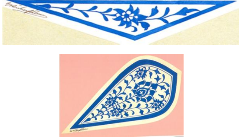
Resim 10: Edirne Muradiye Camii duvar çinileri ve mihrabından sıraltı mavi boyalı çini çizimleri (Dr. Süheyl Ünver'den).

ran'dan gelen gezici ustaların Bursa, Edirne ve İstanbul gibi şehirlerde, kullandıkları yerlerde uyguladıkları “çok renkli sır” (cuerda seca) tekniyi, 15. yüzyıl başından 16. yüzyılın ortalarına kadar varlığını sürdürmüştür. 19 Silisli hamurdan yapılan bu çinilerde, yan yana konulmuş farklı renkte sırlar, pişirme sırasında eriyip birbirine karışmamaları için ince siyah bir çizgiyle birbirlerinden ayrılır, bitkisel ve geometrik motifler kobalt mavisi, turkuaz, beyaz, fıstık yeşili, mor, sarı ve siyahla renklendirilir. Tekniğin 16. yüzyıl örnekleri Topkapı Sarayı Arz Odası ve Sünnet Odası duvarında ve ehzade Mehmed Türbesi (1548) girişinde görülür.