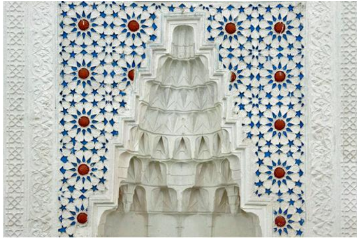
Resim 3: Edirne ah Melek Pa a Camii mihrap kavsarasında yıldız kompozisyonu olu turan firuze sırlı gömme çiniler.

Yıldırım Camii'nde gördü ümüz alçı zemine firuze sırlı geometrik formlu çini gömme uygulaması, ah Melek Pa a Camii'nin alçı mihrabında da kar ımıza çıkmaktadır. Mukarnaslı mihrap ni inin kavsarasındaki on iki kollu yıldızlar burada da baklava ekindeki firuze sırlı çinilerden olu turulmu tur. ah Melek Pa a Camii mihrabındaki kompozisyonda, Yıldırım Camii ocak ni indekilerden farklı olarak, aralarda yıldız formlu firuze sırlı çiniler de görülmektedir. Dairesel olarak dizilmiş yıldız formlu çiniler, on iki kollu yıldızları çevrelerken, aralarına baklava çinilerden olu an sekiz kollu küçük yıldızlar yerle tirilmiştir. On iki kollu yıldızların ortasında çarkıfelek desenli kabalar yer alır. Çini uygulaması, ah Melek Pa a Camii'nin sade görünümlü beyaz alçı mihrabını renklendirmiş ve hareketlendirmiştir (Resim 3).