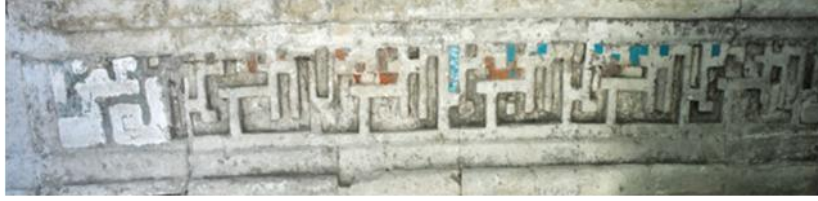
Resim 5: Edirne Şah Melek Paşa Camii taçkapısını süsleyen yazı kuşağının (Allahu Ganiyyün) sol bordüründen firuze sırlı çini kalıntıları (Yazının okuma yönüne göre fotoğraf 90 derece döndürülmüştür)

bir yazı kuşağı yer almaktadır (Resim 5). 11 Küfeki taş üzerine açılan oyuklara yerleştirilmiş firuze sırlı çinilerle oluşturulmuş olan bu yazı kuşağı, bugün ne yazık ki tahrip olmuş, bordürün sol tarafındaki çiniler büyük ölçüde dökülmüş, sağ bordür ise tamamen yenilendiği için özgünlüğünü yitirmiştir.