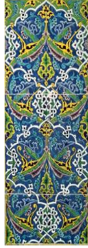
Resim 9a, b, c: Edirne Muradiye Camii Mihrabı ve detayları.