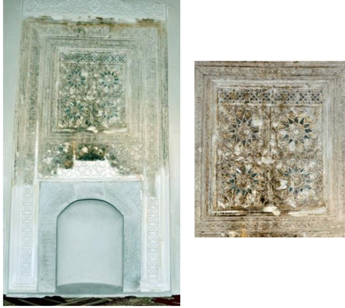
Resim 2a, b: Edirne Yıldırım Camii giriş avanının kuzeyindeki tabhane mekânında alçı ocak nişleri ile bordür ve alınlı mından firuze sırlı gömme çiniler

alınlı mında da on iki kollu yıldızın kollarını olu turan baklava formlu firuze sırlı çini parçaları güney tabhanenin kuzey; kuzey tabhanenin ise güney cephesindeki ocak nişlerinde yer alır. On iki kollu yıldızların göbekleri rozetli kabarıklarla belirtilmiştir. Tabhane mekânları mında da yapının zarif çinilerle bezeli olduğu ancak bunların Rus işçileri sırasında tahrip edildiği de yayınlarda ifade edilmektedir. 7 Güney tabhane mekânındaki çini bezeme daha iyi durumda korunmuş (Resim 1a, b, c), kuzey mekândakiler ise büyük ölçüde tahrip olmuş (Resim 2a, b)