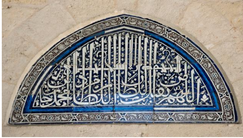
Resim 12a, b: Üç şerefeli Cami avlu pencerelerinin alınlıklarından sıraltı tekni içinde çini panolar.