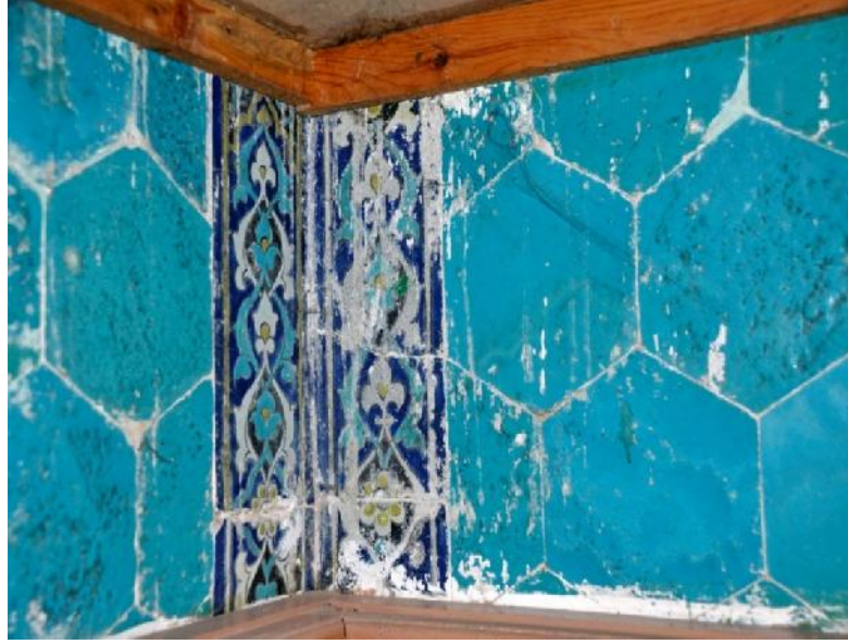
Resim 6: Melek Paşa Camii harimin güneydoğu köşesinden firuze sırlı altıgen çiniler ve renkli sır tekniğindeki dikdörtgen bordür çinileri.

ah Melek Paşa Camii firuze sırlı altıgen çinilerini sınırlayan, çok renkli sır tekniğinde yapılmış dikdörtgen formlu (14x33 cm) bordür çinileri lacivert zemin üzerine beyaz, firuze ve sarı sırlı geçmeli rumi ve palmetlerden oluşmaktadır. Bu bordürün benzerleri, Bursa yapılarından Ye il Cami (1419), Muradiye Camii (1425-6) ile ehzade Mustafa ve Cem Sultan Türbesi'nde (1479) karşımıza çıkmaktadır.