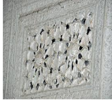
Resim 4 a, b: Edirne Gazi Mihal Bey Camii mihrap alınlı ından yıldız kompozisyonu olu turan siyah sırlı gömme çiniler.

ah Melek Pa a Camii’nin taçkapı çerçevesi üzerinde ise makılı karakterli “Allahu Ganiyyün” (Allah zengindir) ifadesinin tekrarından olu an