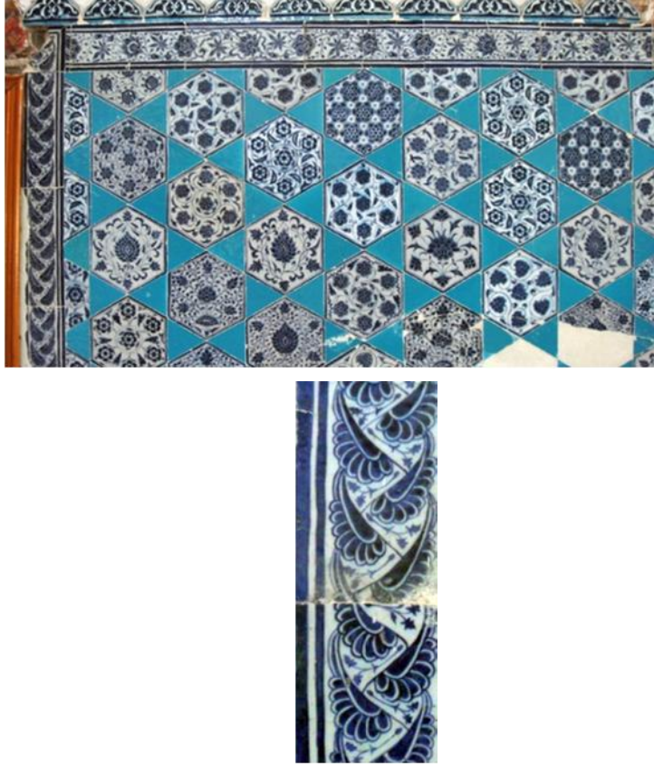
Resim 8a, b: Edirne Muradiye Camii harimin kar ılıklı iki duvarını kaplayan sıralı mavi boya bezemeli altıgen ve firuze sırlı üçgen çiniler ile bordür detayı.