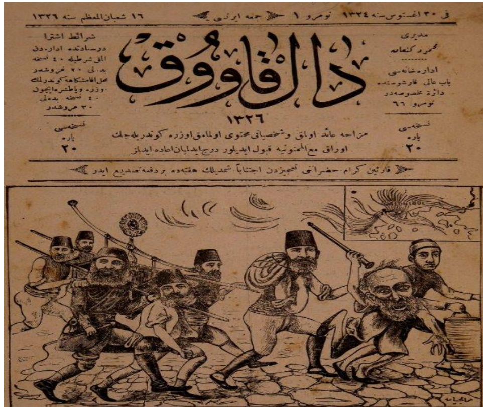
Ek 1: "Reis ha gayret! Ha.. ağalar.. Borucu salla nar'ayı.. Borucu ah yaman gider istibdat köleleri...". (Dalkavuk, 12 Eylül 1908: 1).