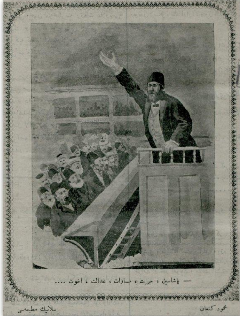
Ek 3: "Yaşasın hürriyet, müsavvat, adalet, uhuvvet...", (Dalkavuk, 6 Mart 1909: 8).