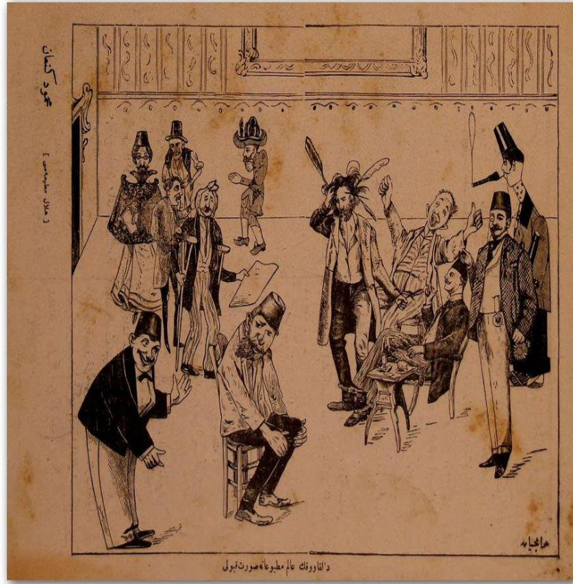
Ek 2: "Dalkavuk'un âlem-i matbuata suret-i kabulü...". (Dalkavuk, 12 Eylül 1908: 8).