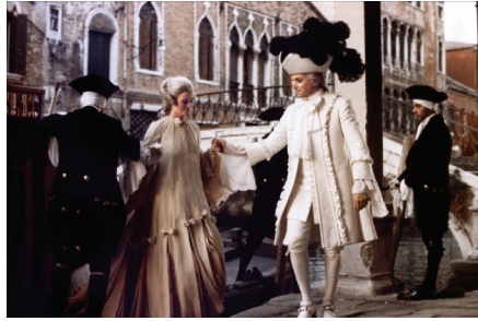
Resim3: Don Jovanni (Picture4: Don Giovanni)

Sanatçılar, farklı sanat alanlarında benzer konular işlemeye başlamıştır. Bu dönemde, felsefe alanında Descartes'ın bıraktığı yerden bayrağı devralan düşünürler, düşünceleriyle toplumu etkilemeye devam etmişlerdir. Gelişen teknoloji sayesinde çoğaltılan yayınlar, düşüncelerin eskisinden daha hızlı yayılmasını sağlamıştır. Böylelikle etkileşim artmış ilerleme katlanarak tüm Avrupa'ya yayılmıştır. La Fontaine , Montaigne ve Locke gibi dönemin önde gelen fikir adamlarının eserleri farklı dillere çevrilerek çoğaltılmıştır. Gelişmekte olan bilim ve değişen toplumsal yaşam, bir takım uyum problemlerini beraberinde getirmiştir . Yaşanan bu karma-