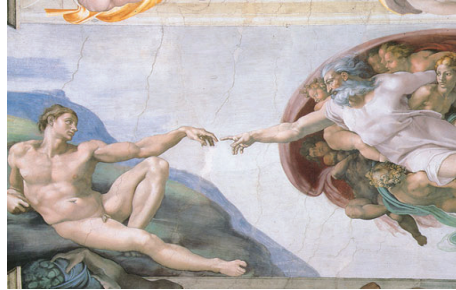
Resim2: Adem'in Yaratılışı (Picture2: Creation of Adam)