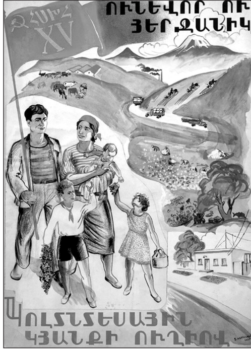
Resim 2: “Sovyet Ailesi” Konulu Propaganda Posterleri

Yananlam boyutunda ele alındığında, posterde Stalin’in önderliğinde başlatılan İkinci Beş Yıllık Plan’a vurgu yapıldığı (1933-1937) görülmektedir. Nitekim, posterde görsel kodlar içerisinde yer alan çiftlikler, Stalin’in kalkınma planında vurguladığı, kırsal alandaki üretim merkezlerinin metonimidir. Görselde yer