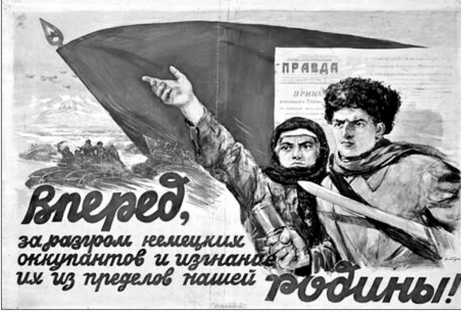
Resim 4: “Vatan Savunması” Konulu Propaganda Posterleri

Yananlam boyutunda görselde, Sovyetler Birliği'nin Stalin önderliğinde Nazi Almanyası'na ve müttefiklerine yapılan genel taarruzu konu edinilmektedir. Görselde yer alan kadın ve erkek, yerel kıyafetler içerisinde Ermeni halkının metonimi olarak kullanılmıştır. İkisinin arkasından gelen tanklar ve uçaklar Kızıl Ordu'nun metonimi olarak yer almıştır. Ayrıca yukarı kaldırılmış olan kırmızı bayrak hem Sovyetler Birliği'ni hem de Kızıl Ordu'yu temsil etmektedir. Diğer posterlerde olduğu gibi, Ermenistan'ı simgelemek amacıyla posterin en arkasında dağ görselleri yerleştirilmiştir. Posterdeki Ermenice “İleri, İstilacıların yenilgisi ve ülkemizden sürülmeleri için ileri!” yazılı kod, Nazi Almanyası'nın Sovyetler Birliği'nden çıkarılmasına vurgu yapmaktadır. Naziler doğrudan Ermenistan'ı işgal etmemiş olmasına karşın, posterde verilen propaganda mesajında, Ermenistan ve Rusya bir bütün olarak değerlendirilerek, Nazilere karşı topyekun bir saldırının başlatılmasına vurgu yapılmaktadır. Posterde Ermeni vatandaşları “kahraman”, Sovyetler Birliği de “kurtarıcı” metaforları olarak sunulmuştur. Posterdeki görsel ve yazılı kodlar bir bütün olarak ele alındığında, posterde Ermenilerin vatanlarını korumak amacıyla Nazilere karşı taarruza geçeceklerine dair propaganda miti inşa edilmeye çalışılmaktadır.