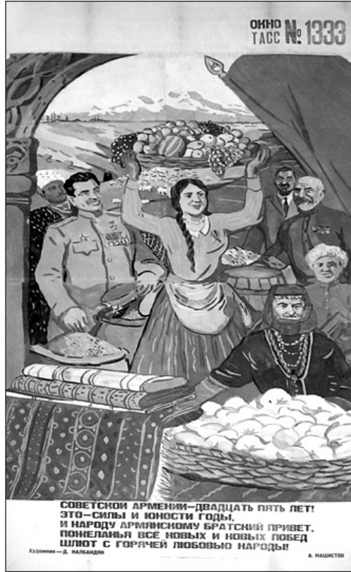
Resim 5: "Sovyet Ermenistanı" Konulu Propaganda Posteri

yılında basılmıştır. Poster düzenlem boyutunda ele alındığında görselde Ermenistan'ın farklı bölgelerini temsil eden yerel kıyafetler içerisinde erkek ve kadınların yansıtıldığı görülmüştür. Posterde, Ermenistan'da üretilen ürünler yansıtılmaktadır. Görselde resmedilen kişilerin sağ göğüslerinde Sovyetler Birliği'ne ait madalyalar yer almaktadır. Poster, 2. Dünya Savaşı döneminde kullanılan diğer iki posterin aksine gök yüzünü aydınlık olarak yansıtmıştır. Kinetik göstergeler içerisinde yer alan jestler, posterde yer alan herkesi mutlu olarak aktarmaktadır. Posterde, incelenen diğer posterlerden farklı olarak Ermenicenin yerine Rusça yazılı kodları kullanılmıştır. Görsellerin hemen altında yer alan Rusça yazılı koddaki "Sovyet Ermenistan'ı 25 yaşında!" şeklinde vurgu yapılmakta ve kod "Bunlar güç ve gençlik yılları, giderek daha fazla zafer kazanma arzusunda olan Ermeni halkına kardeşçe selamlar" şeklinde devam etmektedir.