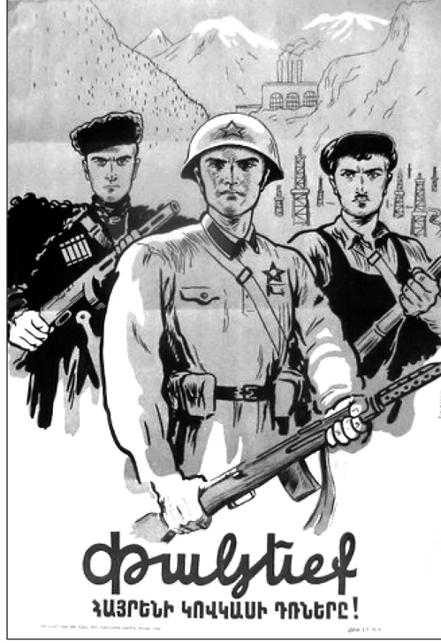
Resim 3: “Vatan Savunması” Konulu Propaganda Posterleri

Yananlam boyutunda poster, Nazilerin 1942 yılında başlattıkları Stalingrad Savaşı'nı konu edinmektedir. Naziler, 1942 yılında Kafkasya'nın kuzeyinde kadar ilerlemişler ve Stalin'in ismini taşıdığından Sovyetler Birliği için manevi bir öneme sahip olan Stalingrad Şehri'nin önünde durmuşlardı. Naziler, Stalingrad'ı alarak Kafkasya'ya ulaşmayı ve bölgedeki zengin petrol yataklarını ele geçirmeyi planlamaktaydı. Bu amaçla Alman General Friedrich Paulus komutasındaki Alman Ordusu, Stalingrad şehrine büyük bir saldırı başlatmıştı. 37 Sovyetler Birliği, Nazileri durdurabilmek için tüm Sovyet cumhuriyetlerinde asker toplamak için yoğun bir propaganda çalışması yürütmüştür. Görselde asker üniforması içerisinde yer alan erkek, Kızıl Ordu'nun, yerel kıyafet ve işçi kıyafeti içerisinde bulunan erkekler ise Ermeni halkının metonimi olarak kullanılmıştır. Askerin, Ermeni erkeklerin önünde bulunması, Kızıl Ordu'nun Ermeni halkını komuta ettiğine vurgu yapmaktadır. Posterde yer alan dağ resimleri Ermenistan'ı simgelemek için kullanılmıştır. Diğer yandan posterde yer alan petrol tesisleri de, Nazilerin ele geçirmeye çalıştığı petrol bölgesini yansıtan metonimlerdir. Sunum kodları içerisinde