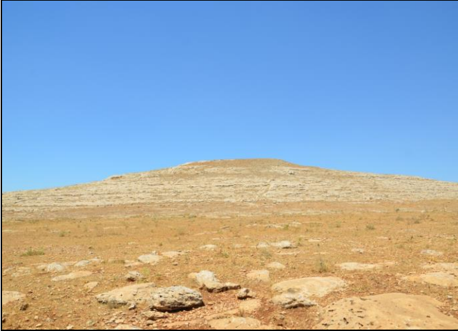
Resim 8. Keçli Tepe Höyüğü Doğudan Görünüm.