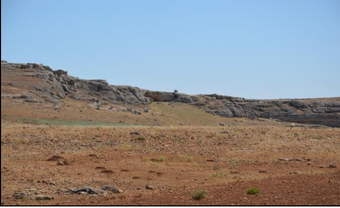
Resim 7. Karahisar Ulban Mevkii Kayaaltı Sığınağı.