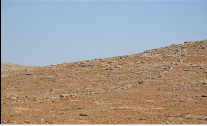
Resim 1. Karahisar Köyü Güneybatı Mevkii Tuzak Alanı.