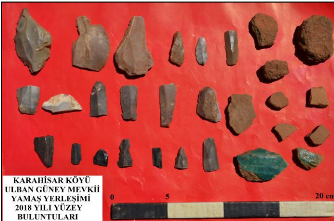
Resim 5. Karahisar Köyü Ulban Güney Mevkii Buluntuları.