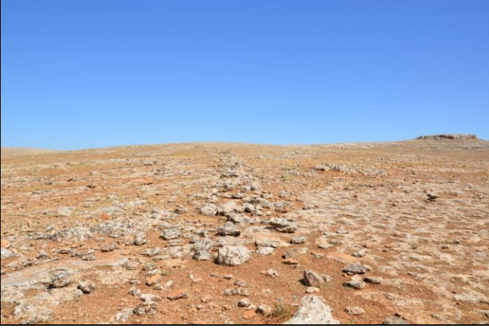
Resim 6. Karahisar Köyü Ulban Kuzeydoğu Mevkii Tuzak Alanı.