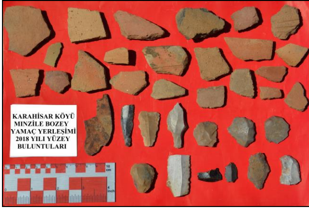
Resim 3. Karahisar Mınzile Bozey Mevkii Buluntuları.