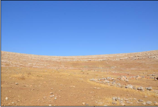
Resim 4. Karahisar Köyü Mınzile İsmail Yamağ Yerleşimi.