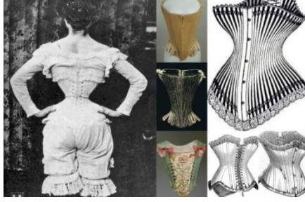
Resim -1: Korse Örneği ve Bel İnceliği