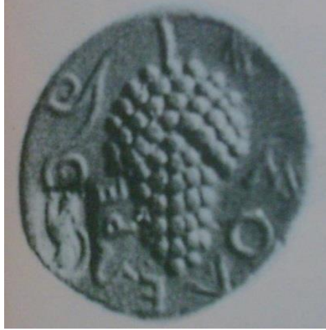
Şekil 5. Üzüm salkımlı sikke

Asma ve üzümün önemi Anadolu kültüründe birçok tarihi kalıntıda kendine yer bulmuştur. Anadolu'nun en eski camisi konumundaki Diyarbakır Ulu Cami, Martoma Kilisesi'nin 639 yılında Müslüman Araplar tarafından camiye çevrilmesiyle oluşturulmuştur. Cami'nin süslemelerinde kullanılan asma yaprakları ve üzüm salkımları (Şekil 6) dikkat çekicidir (Anlı, 2006).