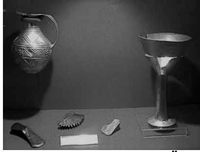
Şekil 2. Anadolu Medeniyetleri Müzesi-Hititler (M.Ö. 3000), som altından yapılmış şarap sürahesi ve ayaklı şarap kadehi

Anadolu'da asmanın tarihçesi Anadolu'daki medeniyetler ile başlamaktadır. Şarabın tarihi çok daha eski olmasına rağmen kültürünün Hititler döneminde başladığı düşünülmektedir. Anadolu Medeniyetleri Müzesi'nde sergilenen Hititler'den kalma M.Ö. 3000'lere ait som altından yapılmış şarap sürahesi ve ayaklı şarap kadehi (Şekil 2), bulunmuş en eski şarap kabıdır (Deliorman ve ark., 2011).