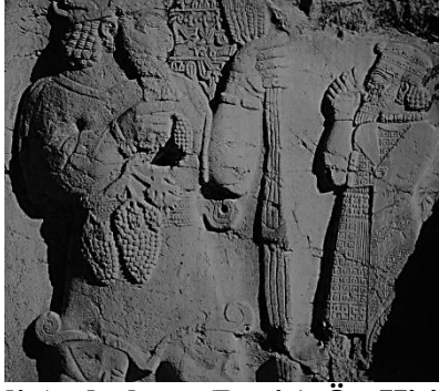
Şekil 1. Konya, Ereğli Aydıncıkent (Dvriz)-Ön Hititler (M.Ö. 1200-742), Kral Warpalavas'a ait Dvriz Kaya Kabartması

Anadolu'da asmanın tarihçesi Anadolu'daki medeniyetler ile başlamaktadır. Şarabın tarihi çok daha eski olmasına rağmen kültürünün Hititler döneminde başladığı düşünülmektedir. Anadolu Medeniyetleri Müzesi'nde sergilenen Hititler'den kalma M.Ö. 3000'lere ait som altından yapılmış şarap sürahesi ve ayaklı şarap kadehi (Şekil 2), bulunmuş en eski şarap kabıdır (Deliorman ve ark., 2011).