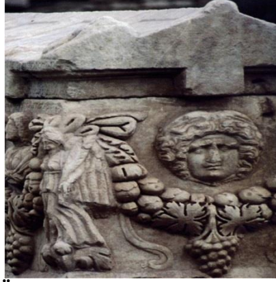
Şekil 7. Üzüm ve insan figürlü mezar süslemesi

Anadolu’da bağcılık birçok yörede yapılmıştır. Örneğin; Van’da Urartular’dan (M.Ö. 900–600) kalan Menua (Semiramis, Samram) sulama kanalı ve çevresindeki asma bahçeleri eski belgelerde çokça anlatılmıştır (Anlı, 2006).