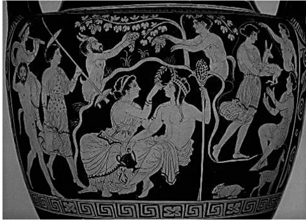
Şekil 3. Bir toprak kaptta asma, üzüm ve Dionysos tasviri

Anadolu'da Frigya Bölgesi'nde Roma Dönemi'nde (M.S. 200–300) adak stellerinde tanrılar resmedilmiştir (Şekil 3). Zeus Ampelikos ve Zeus Ampeleitos bunlardan olup üzüm bağlarını koruduklarına inanılırdı. (Anlı, 2006).