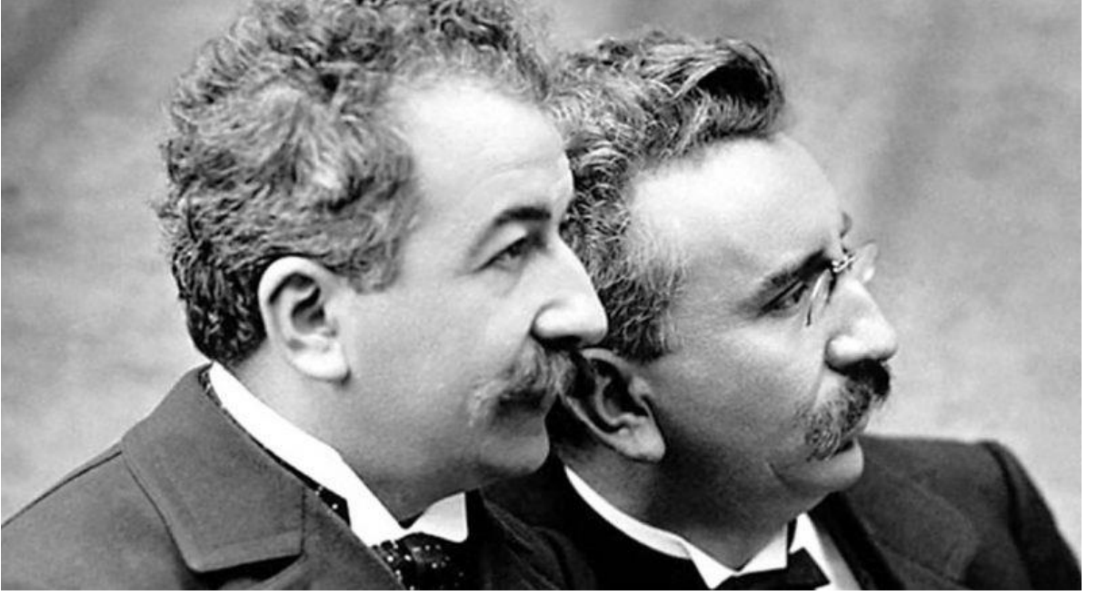
F.1: Auguste ve Louis Lumiere Kardeşler