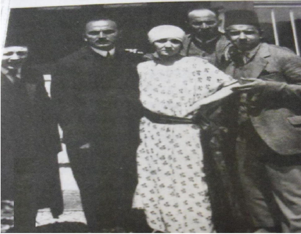
F.2: 1923'te çekilen " Ateşten Gömlek " filmi setinden bir kesit