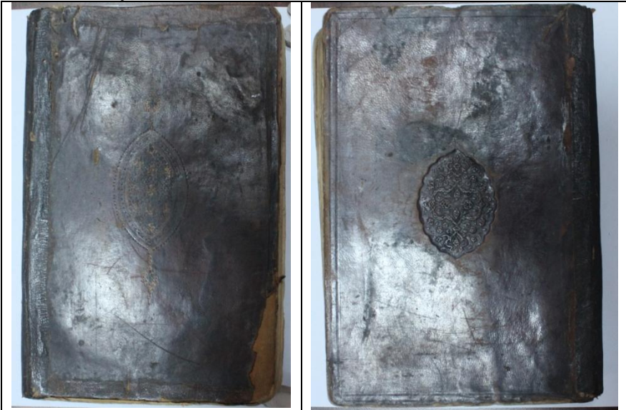
Resim:1, Örnek1, Mesabihu's-Sünne, 760/1359, Balıkesir Mutasarrıf Ömer Ali Bey YEK,679, Ön ve Arka Kapak.

Salbeklerin, şemse ile arasında ki bağ, zencirek motifleriyle bağlanmış ve altınla süslenmiştir.