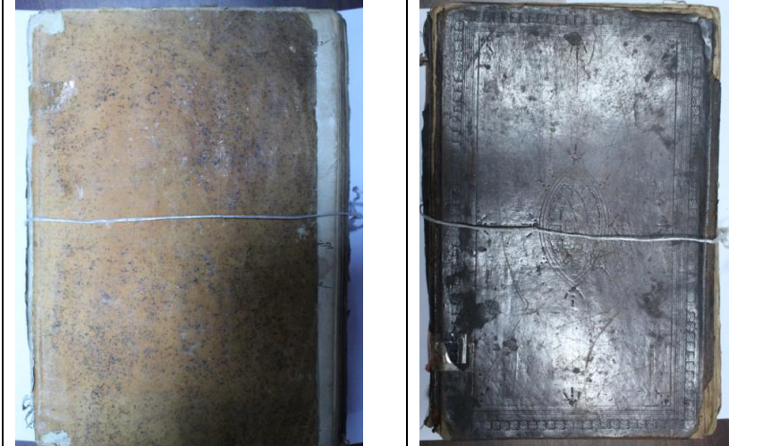
Resim9: Örnek9, Hulâsatu'l-Fetava, 15.yy.'ın ilk yarısı, Balıkesir Mutasarrıf Ömer Ali Bey Kütüphanesi, 1187, Ön ve Arka Kapak.

Kapak köşebendi, bir gülçe etrafında 3 adet kakma ve ucunda ise tığ motifiyle oluşturulmuştur. Kapak şemsesi, 78 mm çapında mekik şemde tarzındadır. İçinde, iki motifin birbirine geçmesiyle oluşturulmuş bir süsleme hakimdir. Şemsenin etrafını iki oval halka çevrelemekte olup halkalar arasında 2 mm genişlik mevcuttur. Şemsenin dışında ise kakma ve tığlarla oluşturulmuş süslemeler hakimdir.