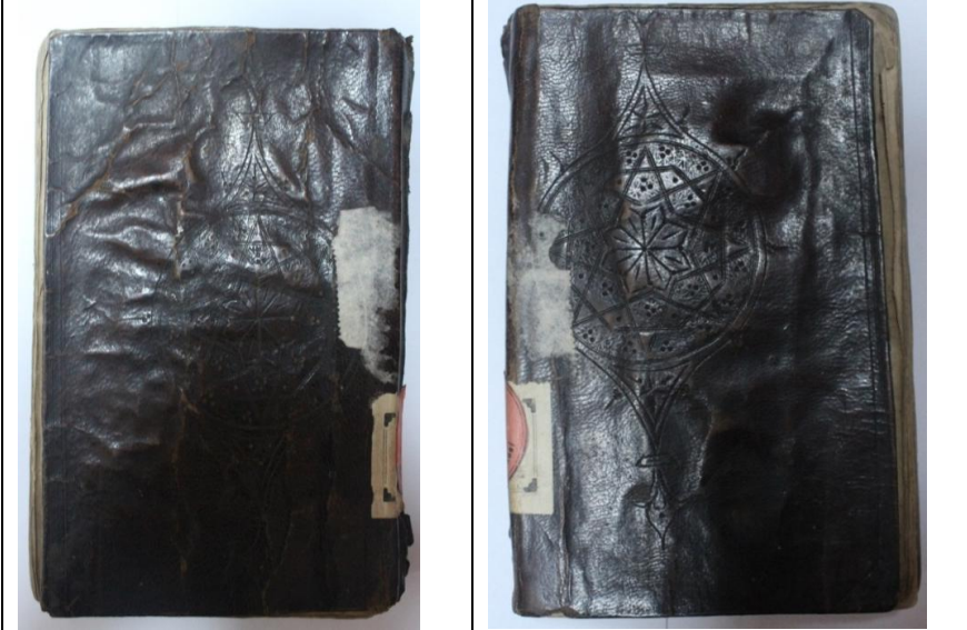
Resim15: Örnek15, el- Vâfiye fi Şerhi'l-Kâfiye, .../..., Balıkesir Mutasarrıf Ömer Ali Bey YEK, 452, Ön ve Arka Kapak.

Kapak şemseleri, 70 mm çapında yuvarlaklardan ovale geçiş hazırlıklı tarzdadır. İçleri 4 kollu yıldızdan türeyen geometrik motiflerle ve üçerli kakmalarla tezyin edilmiştir. Şemsenin etrafı 6 adet tıgla çevrilmiştir. Şemsenin iki ucundan tepelik formunda 25 mm uzunluğunda salbekler görülmektedir. Salbekler şemseye üçgen formda oluşturulmuş motifle bağlanmıştır.