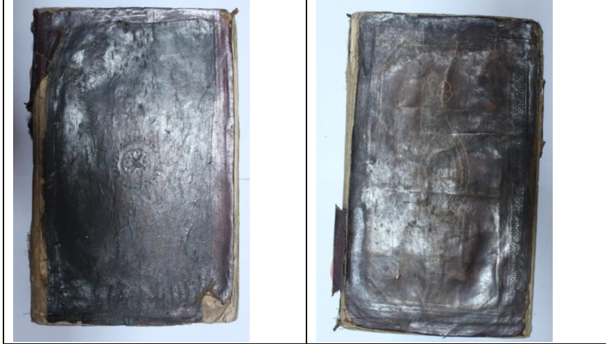
Resim8: Örnek8, Şerhu Mecma'î'l-Bahreyn ve Mülteka'n-Nehreyn, 878/1474, Balıkesir Mutasarrıf Ömer Ali Bey YEK,820, Ön ve Arka Kapak.

Arka kapak şemsesi, 55 mm çapında 110 mm uzunluğunda mekik şemse tarzında ve salbeklidir. Şemsenin etrafı tek sıra altınla tahrirlenmiştir. İç halka da ise yine altınla sarmal zencirek motifi uygulanmıştır. Şemse uçlarındaki orta bağ ve salbekleri yine altınla süslenmiştir. Salbekler tepelik formundadır.