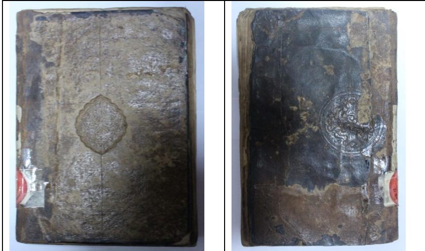
Resim10: Örnek10,İmtihânü'l -ezkiyâ, 1056/1646, Balıkesir Mutasarrıf Ömer Ali Bey YEK, 44, Ön ve Arka Kapak.

Arka kapak şemsesi, 38 mm çapında dilimli oval şemse formunda olup salbeksizdir. Şemse içleri saz üslubunda seyrek şekilde süslenerek tezyin edilmiştir.