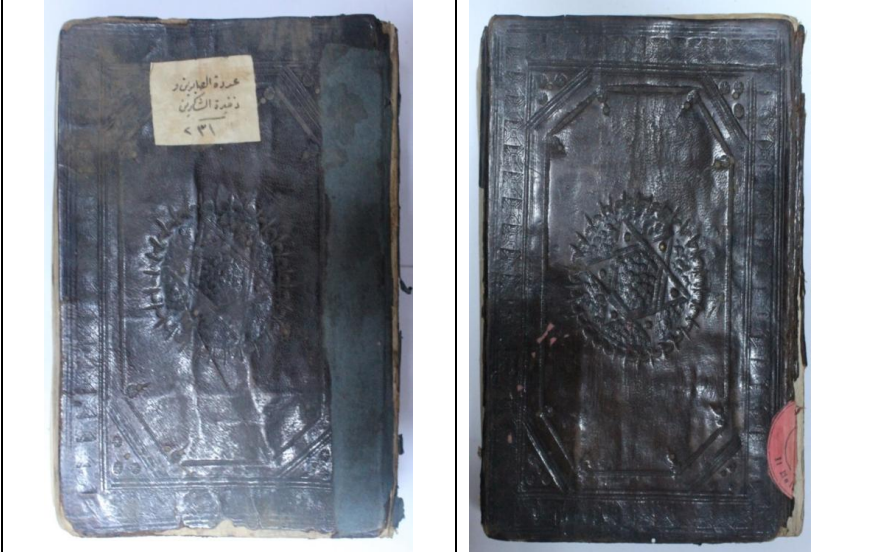
Resim:2 Örnek2, Uddetü's-Sabirin ve Zahîrüt'ş-Şakirin, 816 /1412, Balikesir Mutasarrıf Ömer Ali Bey YEK, 890, Ön ve Arka Kapak.

Kapak şemseleri, 55 mm çapında yuvarlak tarzdadır. Şemse dıştan küçük dilimlerle ve tığlarla çevrili olup içi; iç içe geçmiş iki üçgenin oluşturduğu altıgen bir motif ve motifin içi ise altın kakma süslemelerle tezyin edilmiştir. Altıgenin içi ve üçgenlerin oluşturduğu motifin dışında kalan kısım ise gülçelerle süslenmiştir.