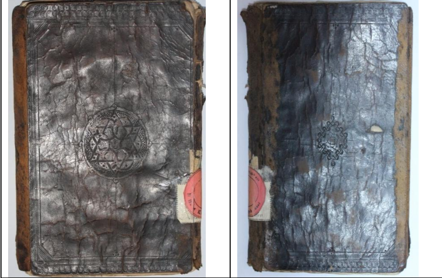
Resim 13: Örnek13, Envaru't-Tenzil ve Esrâru't-Te'vil, 1126/1714, Balikesir Mutasarrıf Ömer Ali Bey YEK, 204, Ön ve Arka Kapak.

Mikleb zencirekleri kapaklarla aynı olup, şemsesi 70 mm çapında iki tane üçgenin birbirine geçmesiyle oluşturulmuş geometrik tezyin ile süslenmiştir. Etrafında 4 adet tığ ve bir tepelik mevcuttur. Kapak içleri kâğıt kaplıdır.