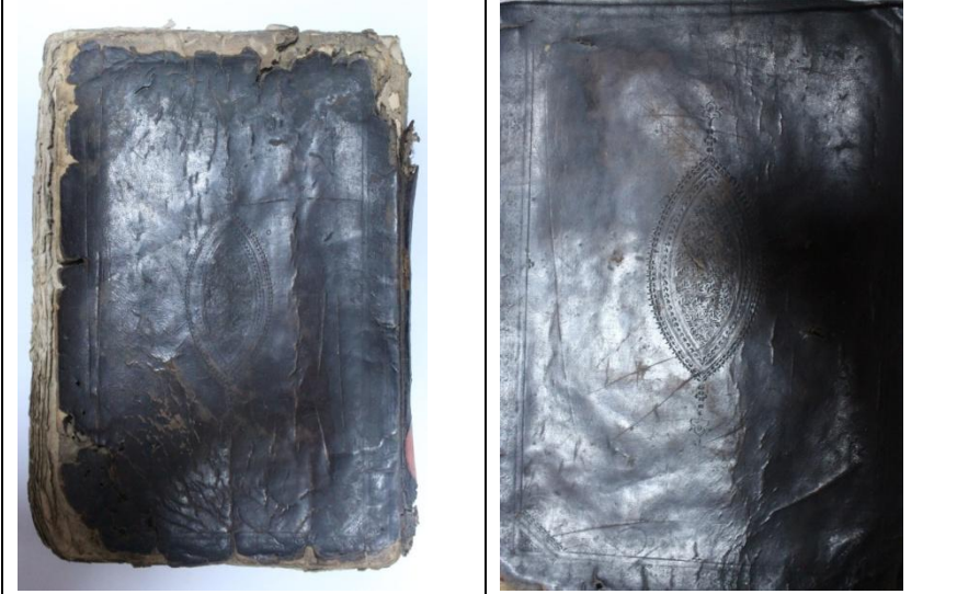
Resim6: Örnek6, Dav'u'l-Misbâh, 852/1447, Balıkesir Mutasarrıf Ömer Ali Bey YEK, 1110, Ön ve Arka Kapak.

Kapak şemseleri, 45 mm çapında düz oval şemse tarzındadır. İçleri, tığlarla tezyin edilmiş ve şemsenin çevresi de aynı şekilde yarım daire formunda tığlarla çevrelenmiştir.