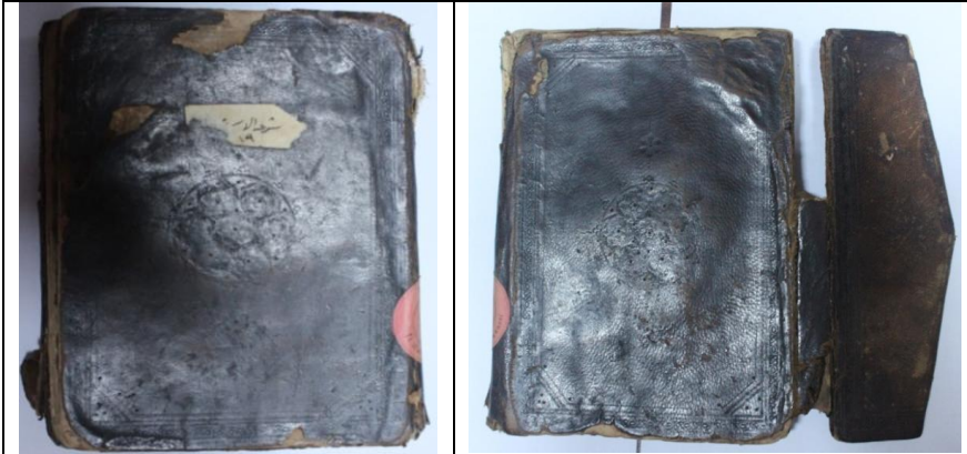
Resim 11: Örnek11,Şir'âtü'l-İslâm, 1060/1650, Balıkesir Mutasarrıf Ömer Ali Bey YEK, 894, Ön ve Arka Kapak.

Mikleb kısmındaki zencirek ve köşebentler kapaktakilerle aynı olup, şemsesi ise 4 adet tepeliğinin bir araya gelmesiyle tezyin edilmiş ve etrafı tığlarla çevrilmiştir.