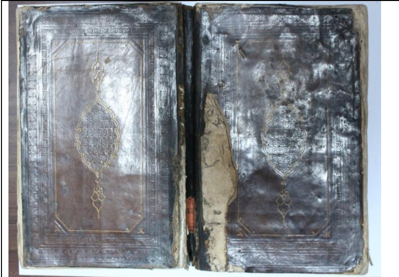
Resim7: Örnekleme, İhya'u Ulûmi'd-Dîn , 866/1461, Balıkesir Mutasarrıf Ömer Ali Bey YEK, 828, Ön ve Arka Kapak.

Kapak şemseleri, 46 mm çapında dilimli oval ve salbeklidir. Şemseler çift sıra altınla tahrirlenmiş ve bu bordürler 2 mm genişliğindedir. İçleri, geometrik geçmelerle ve altın tığlarla tezyin edilmiştir. Salbekler yine altınlı tepelik formundadır.