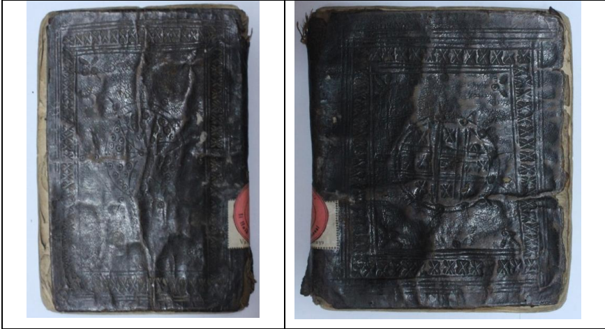
Resim 5: Örnek5, Şerhu'l-Ferâ'izi's-Sirâciye, 840/1437, Balıkesir Mutasarrıf Ömer Ali Bey YEK,502/1, Ön ve Arka Kapak.

Ön kapak şemsesi yuvarlak tarzda, 55 mm çapında ve şemsenin çevresini 5 mm kalınlığında bir bordür çevrelemektedir. İçi, çiçek tarzında bir motif ve etrafı halkalarla tezyin edilmiştir. Arka kapak şemsesi yuvarlak tarzda, 55 mm