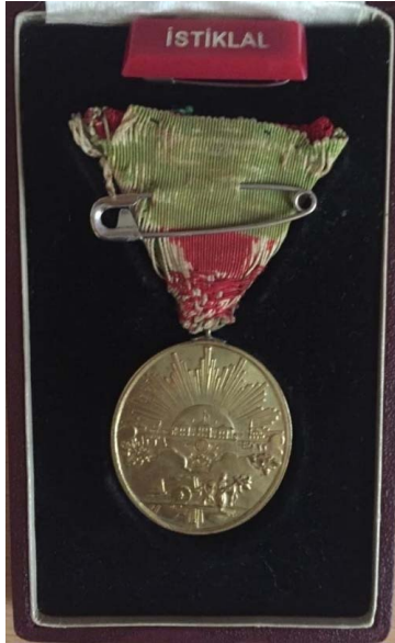
Bahri Tathođlu'na Ait İstiklâl Mâdalyası