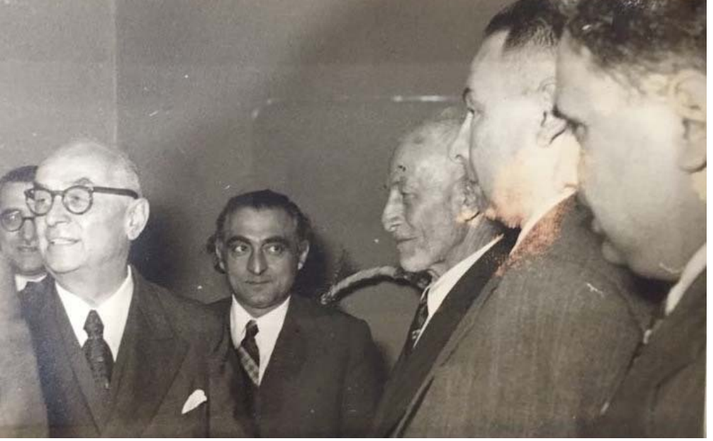
Celal Bayar ve Bahri Tatlıođlu