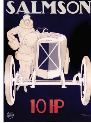
Resim 8. René Vincent, 'Salmson 10hp', 1920 (Lopez, 2014, s64).

Bundan dolayıdır ki erken dönem reklam illüstrasyonlarında "genç + kadın" figürü müşterinin satın alma davranışlarını manipüle etmek adına sigara, bisiklet ve pek tabii otomobil reklamlarında kullanılır (Wolfgang & Reneau, 1992, s. 39).