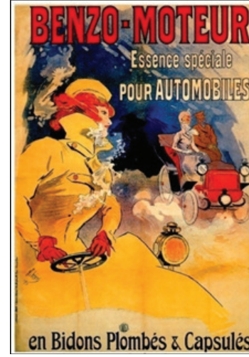
Resim 5. Jules Chéret, 'BenzoMoteur', 1900 (Lopez, 2014, s226).