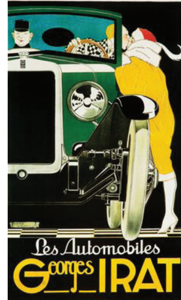
Resim 9. René Vincent, 'Georges Irat Cars', 1920 (Favre, 2007, s36).

Öte yandan 1930'lar şıklık ve modanın patladığı yıllardır. Otomobil afişleri ve illüstrasyonları şık ve göz kamaştırıcı bedenleri, lüks elbiseleri sergileyen mankenleri ve genç sürücüleri betimler. (Resim 7-8) İsteddiği yere istediği anda şoförsüz olarak seyahat edebilen film yıldızı yada burjuva kadını alıcısına iletir (Favre, 2007, s. 225). Bütün bu semiyotik ve