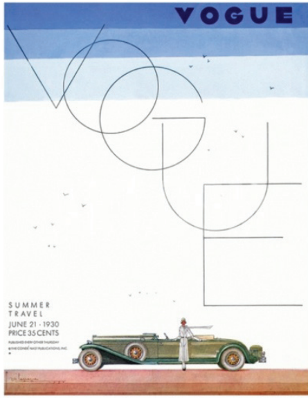
Resim 10. Georges Lepape, 'Otomobilli kadın' Vogue dergi kapağı, Haziran 1930, (Sachs, 1992, s39).

semantik mesajlar, binlerce kadının rüyalarını yapılandırır. Bu anlamda Vogue Dergisi Haziran 1930 sayısının Georges Lepape imzalı kapağı, Art Deco stiline sahip olmakla birlikte, otomobil ve kadın imgesinin kompozisyonundaki kullanımına yer vermesi örneğinde gözlemlenmektedir. 1930'lar boyunca reklamlarda ve afişlerde otomobil ile kadın yan yana görünmeye devam eder. (Resim 10) Araba, burjuva hayatı için bir ihtiyaçtan çok duygusal bir gereklilik olarak sunulmuştur (Wolfgang & Reneau, 1992, s. 38).