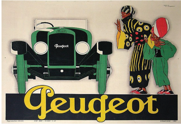
Resim 7. René Vincent, 'Peugeot Tip 153', 1923 (Favre, 2007, s42-43).

Kadınların dünyası ve kadın imgesi kapitalist dünyanın tüketim değerlerini somutlaştırarak, tüketim kültürünün alegorisi olarak merkeze oturur. Öte tarafta, 20'li ve 30'lu yılların reklam ve afişlerinde kadın, gençlik ve otomobil üçlemesi hâkimdir. Genç ve gençlik ise yeni olanın alegorisi olmuştur.