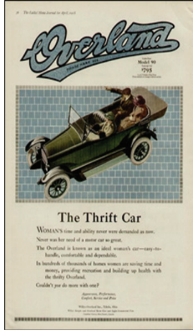
Resim 4. Saturday Evening Post, 'Willy's Overland İlanı', 1918 (Vaknin, 2008, s21).