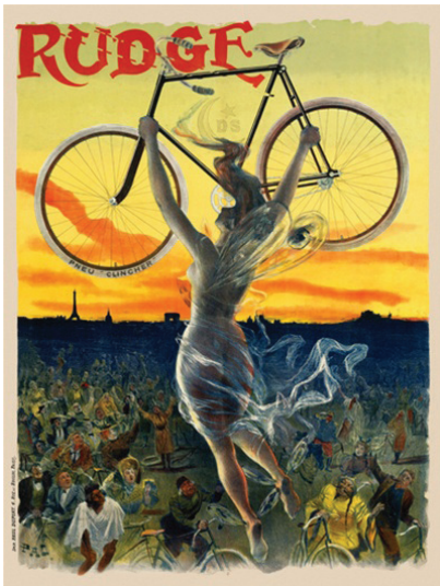
Resim 1. Geo Pal 'Rudge' reklam afişi.

Bu afişler reklamcılıktaki üslupsal geçişi sergiler. (Resim 2) Victoria Dönemi’nin tipografik sokak ilânları ile Art-Nouveau’nun renkli illüstrasyonlu afişleri arasında geçiş medyumu gibi görünürler. Ağırbaşlı ve ciddi reklam içeriği, tipografik satır blokları halinde verilirken, araçlar ise kaputları geleceğe (sağa) bakarken resmedilir (Vaknin, 2008, s. 14-15)