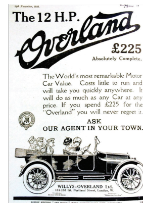
Resim 3. Motor Dergisi, 'Willy's Overland İlanı', 1916 (Vaknin, 2008, s20).

Başlarda otomobil reklamları erkek müşterileri hedeflemişken, ilerleyen dönemde kadın müşterilere yönelik otomobillerin piyasaya sürülmesi ile beraber, reklamların hedefinde öncelik sırası kadınlara verilir (Heimann&Patton, 2009, s. 9-15). İlk kadın havacıların toplum üzerinde yaptığı etkinin bir benzeri de karada hüküm sürer. Bu anlamda, Uzés Düşesinin otomobil ehliyeti alan ilk kadın olması kadın-otomobil arasındaki görsel ve imgesel bağların ilk örneklerinin afişlerde görülmesini hızlandırmıştır (Lopez, 2014, s. 11). (Resim 3) 1916 yılına ait Willy's Overland ilânında geniş planda, arka koltukta üç asker bir kadın sürücün kullandığı araç ile hareket halinde betimlenmiştir. 1918 yılına ait Willy's Overland reklamında ise üst plandan kadrajlı olarak yine bir kadın sürücü yer alır ve bu kez yolcularını, belki de arkadaşlarını götürürken resmedilir (Resim 4) (Vaknin, 2008, s. 21).