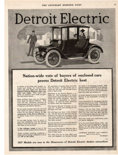
Resim 2. Saturday Evening Post, 'Detroit Electric İlanı' (Vaknin, 2008, s17).

Başlarda otomobil reklamları erkek müşterileri hedeflemişken, ilerleyen dönemde kadın müşterilere yönelik otomobillerin piyasaya sürülmesi ile beraber, reklamların hedefinde öncelik sırası kadınlara verilir (Heimann&Patton, 2009, s. 9-15). İlk kadın havacıların toplum üzerinde yaptığı etkinin bir benzeri de karada hüküm sürer. Bu anlamda, Uzés Düşesinin otomobil ehliyeti alan ilk kadın olması kadın-otomobil arasındaki görsel ve imgesel bağların ilk örneklerinin afişlerde görülmesini hızlandırmıştır (Lopez, 2014, s. 11). (Resim 3) 1916 yılına ait Willy's Overland ilânında geniş planda, arka koltukta üç asker bir kadın sürücün kullandığı araç ile hareket halinde betimlenmiştir. 1918 yılına ait Willy's Overland reklamında ise üst plandan kadrajlı olarak yine bir kadın sürücü yer alır ve bu kez yolcularını, belki de arkadaşlarını götürürken resmedilir (Resim 4) (Vaknin, 2008, s. 21).