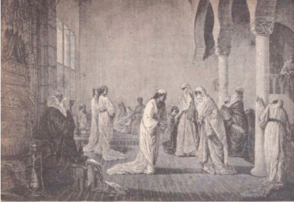
Kadınların haremden misafir kabulü merasimi (Bu pek güzel tablonun ressamı Madam Henriette Brovn'dur)

Bir buçuk asır evvelki İstanbulda, kibar Türk kadınlarının hayatı