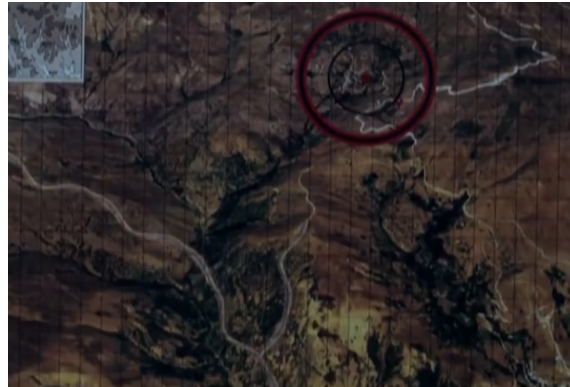
Resim 3. Darbe Girişiminin Başarılı Olması Halinde İşgalcilerin Gireceği Güney Sınır Noktası