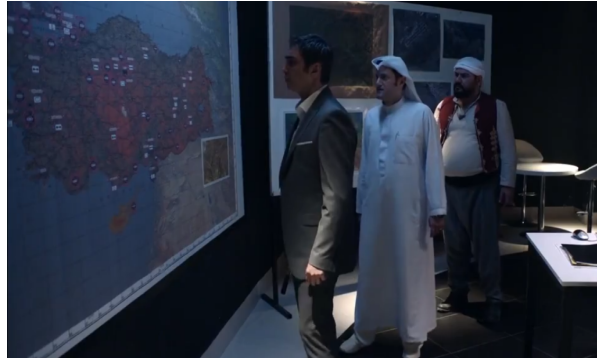
Resim 2. Türkiye’deki Önemli Stratejik Noktaları Gösteren Haritanın Bulunması

Kesit değişir. Özne konumundaki kahraman Polat Alemdar ve ekibi Irak/Erbil’de görülür. Bir otelde Polat Alemdar ve adamlarıyla henüz kim olduğu bilinmeyen birtakım insanlar arasında çatışma çıkar. İlerleyen sahnelerde izleyici, Polat’ın yeşil cübbe getiren ve darbe emrini veren Dave’ı aradığını öğrenir. Çıkan çatışmada herkesin ölmesi üzerine herhangi bir bilgiye ulaşamayan anlatının kahramanı, yan odanın duvarına asılı bir harita bulur. Bu harita anlatıyı ileriye doğru devindirecek kahramanın ulaşmaya çalışacağı yitik/arzu nesnesinin de ortaya çıkmasını sağlar. Haritada Türkiye Cumhuriyeti Devleti’ne ait özel hareket merkezleri ve askeri birlikler gibi stratejik önem taşıyan noktaların işaretli olduğu görülür (Akıncı Üssü, Özel Harekât Başkanlığı, Özel Kuvvetler Komutanlığı, MİT, Genel Kurmay Başkanlığı, İzmir Ana Jet Üssü, İncirlik, Diyarbakır Ana Jet Üssü). Tüm bu önemli noktaların yanı sıra güney sınırında işaretlenen bir yer daha vardır. Anlatının kahramanı özellikle işaretlenen bu noktada ne olduğunu görmek ve anlamak ister. Böylece Polat Alemdar ve ekibinin Yalavuz adlı sınır köyüne/sınır kapısına olan yolculuğu bu kesit itibarıyla başlar.