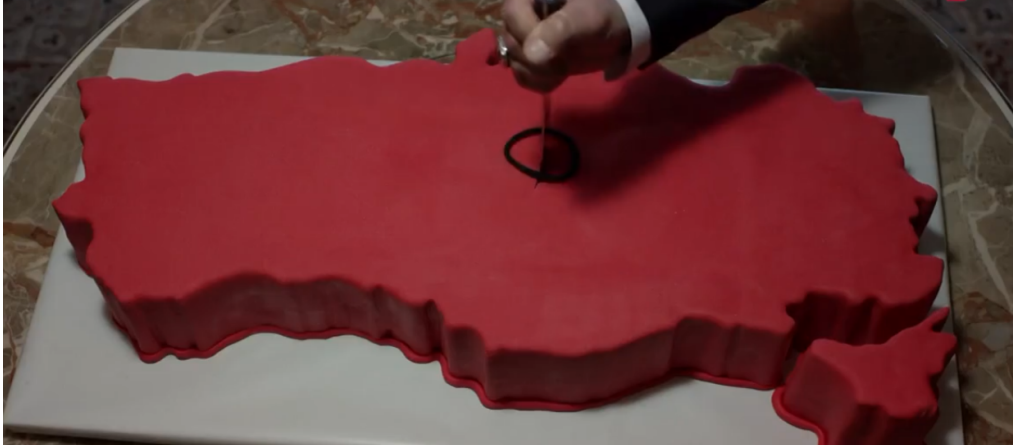
Resim 4. Dave'in Küresel Şirketlere Yaptığı Konuşmada Türkiye'yi Bir Pastaya Benzettiği ve Küresel Şirketlere Bölüştürdüğü Sahne.

Kesit değişir. Polat Alemdar ve adamları, Yalavuz'a doğru yola çıkar. Bu sırada Dave, Polat'ın varlığından haberdar olur ve darbe girişiminin tehlikeye girmesini istemeyerek operasyonu başlatma kararı alır. Aynı zamanda Polat'ın Yalavuz'a giderken içinde bulunduğu helikopteri de füzeyle düşürmek ister. Helikopterin düşürülme işini ise sahneden de açıkça anlaşılacağı üzere Türkiye'nin uzun yıllardır mücadele verdiği PKK ya da bu örgütün diğer ülkelerdeki uzantıları üstlenir. Anlatı ilerledikçe öteki olarak konumlanan Batı'nın hem temsil edilme biçimi değişir hem de müttefiklerinin sayısı artar. Batı acımasızca kan dökebilen, amacı uğruna biri ya da birilerini öldürmekten çekinmeyen olarak temsil edilir. FETÖ, PKK, YPG, DAESH vb. gibi terörist grupların Batı'nın emrinde olduğu açıkça gösterilir. Anlatının kahramanı ve arkadaşları bu füze saldırısından kurtulmayı başarır.