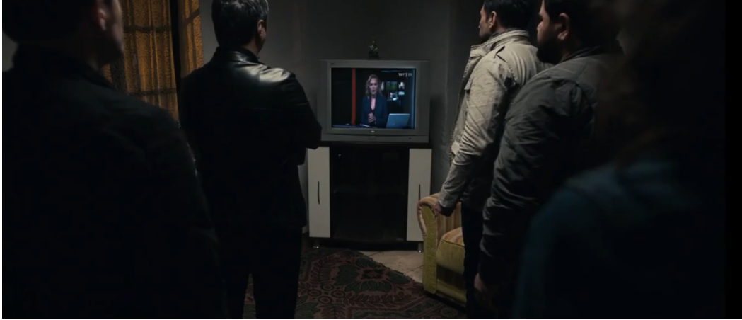
Resim 6. Darbe Metninin TRT Ekranlarında Zorla Okutulduğunu Gösteren Sahne

Füze atışında helikopterin pilotu ağır yaralanır. Bu yaralanma sonucunda Polat ve arkadaşlarının köydeki hemşire ve öğretmen ile yolları kesişir. Fakat tedavi için geç kalınmıştır, pilot ölür. Polat ölen arkadaşının üzerini “ hakkını helal et kardeşim ” diyerek beyaz bir çarşafı örter. Film anlatısındaki Batılı ve Doğulu arasındaki zıtlıklardan biri daha ortaya çıkar. Batılı gözünü kırpmadan birini öldürebilirken ve arkasına dahi bakmazken, Doğulu konumunda olan Türk ve Müslüman ise ölen kişiyi helallik isteyerek uğurlar.