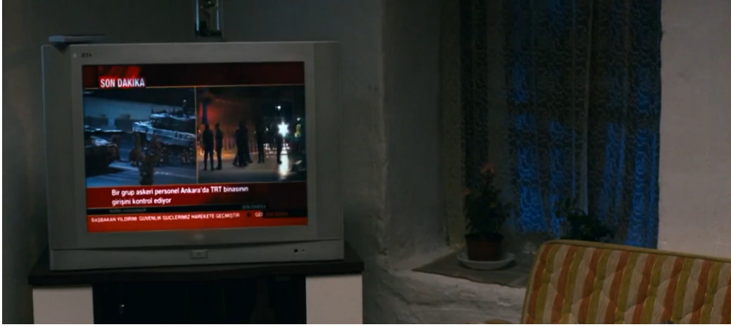
Resim 5. 15 Temmuz Darbe Girişiminin Başladığına Dair Gerçek Görüntülerin Televizyon Ekranına Yansması