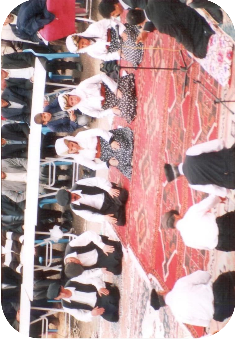
Talipler yöresel kıyafetleriyle cem erkânı yürütürken.