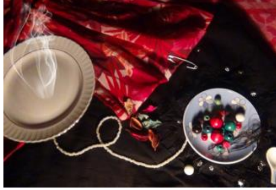
Resim 3. Şefika'nın nesne dönüştürme etkinliğine yerleştirme çalışması

Öğrencilerin çalışmaları bu noktadan değerlendirildiğinde özellikle ilk etkinlik olan nesne dönüştürme çalışmalarında çok fazla nesne ile ifade yoluna gittikleri ve izleyiciye düşünme payı bırakmadıkları görülür. Araştırmacının yönlendirmeleriyle birlikte ikinci çalışmaları olan sofraya düzeni ve yolculuk etkinliğinde bu durumdan bir parça sıyrıldıkları, az nesne ile ifade yoluna gittikleri anlaşılır. Ancak bu noktada da çalışmalarda yan anlam yerine düz anlam kullanımı ile düşünce iletmeye çalıştıkları ortaya çıkar. Öğrencilerin bu tarz hatalara düşmeleri gayet normal kabul edilebilir. Çünkü sadece bir dönem boyunca teorik ve uygulama şeklinde gördükleri ders kapsamında bu uygulamaları gerçekleştirdiklerinden dolayı hatalar yapabilirler. Kavramsal sanat uzun bir süreç ve altyapı gerektirir. Öğrencilerin yaptıkları çalışmaların her biri bu süreci deneyimlediklerinden dolayı önemli ve değerli görülmüştür.