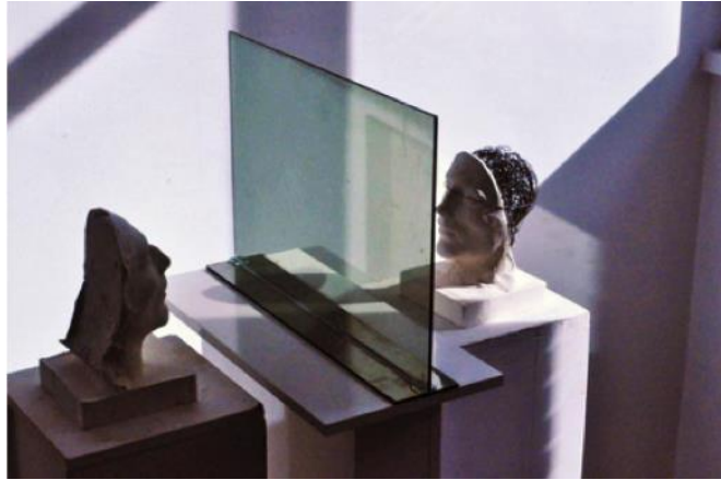
Resim 1. Oktay'ın nesne dönüştürme etkinliğine ait yerleştirme çalışması.

Yukarıdaki tabloyu incelediğimizde öğrencilerden dördünün ifade aracı olarak video sanatını seçtikleri, birisinin yerleştirme yaptığı, kalan birisinin de afiş çalışması yaptığı görülmektedir. Ele aldıkları kavramları incelediğimizde ise etkinliğin yapısı itibariyle hayatlarından yola çıkan çalışmalar gerçekleştirdikleri ve genel olarak olumsuz yönde etkilendikleri olayları seçtikleri anlaşılmaktadır. Öğrencilere bu durum sorulduğunda, negatif şeylerin yaşamlarında daha fazla iz bıraktığı ve olumlu şeylere göre daha fazla hatırlandığı yönünde yanıtlar alınmıştır.