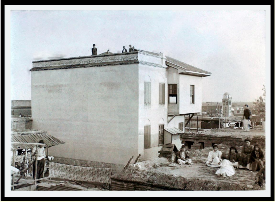
Şekil 1. Adana Misyon Yerleşkesi 1903