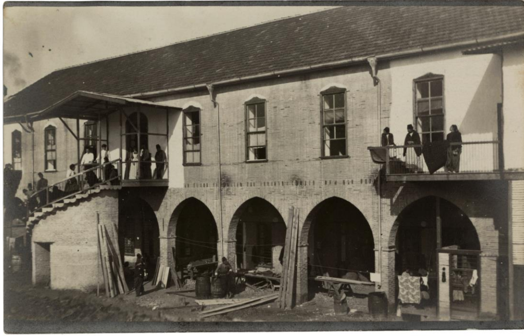
Şekil 7. Hastanenin Erkekler Koğuşu 1910