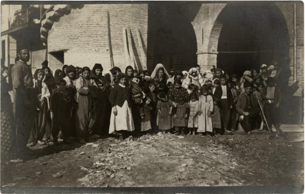
Şekil 6. Hastane Önünde Bekleyen Hastalar 1909