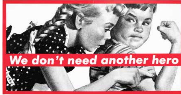
Görsel 3. Barbara Kruger, "Untitled (We don't need another hero)", 276.54 x 531.34 x 6.35 cm, Silkscreen on vinyl, 1987, Whitney Museum of American Art, New York.

" We Don't Need Another Hero (Başka Bir Kahramana İhtiyacımız Yok) " isimli çalışması da (Görsel 3), sanatta feminist hareketin önemli göstergelerini sunmaktadır. Kadının güçlü olduğunu, bağımsız bir bilinç olarak da yaşamsal varoluşta yer alabileceğini, 'öteki'ne, bir başkasına ihtiyacı olmadığını vurgulamaktadır. Bu çalışmada Kruger'in feminist hareketin başlarında kadın erkek eşitliğini savunan manifestonun aksine, kadının erkeğe ihtiyaç duymaması sloganı üzerinde, kadını yüceltme yoluna gitmiş ve dengeyi kadınsal çizgiye çekerek, kadının üstünlüğüne gönderme yapmıştır. 'Biz' olarak ifade ettiği topluluk tüm insanlığın ötekileştirilmiş kadınlarıdır ve her türlü dil, din, ırk ayrımı yapılmadan kendi farkındalıklarını geliştirmeleri üzerine eleştirel bir söylem diliyle mesaj görsellik ve tipografik etki ile vurgulanmıştır.