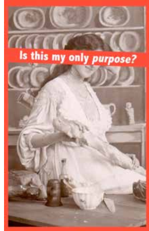
Görsel 5. Barbara Kruger, "Untitled ( Is this my only purpose?/Bu yapmam gereken tek şey mi? )", 1992

Kruger gene toplumsal sistem içinde kadına atfedilen rolleri eleştirel ve kendine özgü söylem diliyle aktardığı " Is This My Only Purpose (Bu Yapmam Gereken Tek Şey Mi?) " isimli çalışmasında (Görsel 5), kadın figürünü yemek yapma eylemi içerisinde betimlemiştir. Tarih boyunca erkeğin bağımsız olarak gerçekleştirdiği eylemler ve çalışma görevlerinin karşısına yerleştirilen kadının erkeğe bağımlı ve ev içerisindeki görevleri feminist sanat hareketi içerisinde farklı sanatçılar tarafından seçilen ve eleştirel bir yaklaşımla vurgu yapılan temel konulardan biri olmuştur.