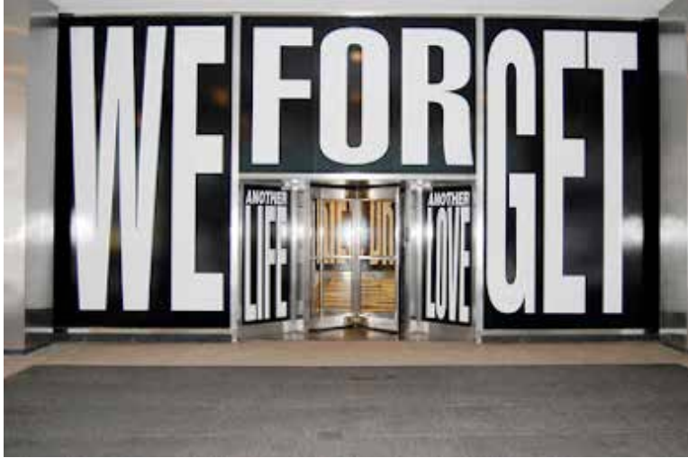
Görsel 9. Barbara Kruger, "Between Being Born and Dying" interior installation, 2009, Lever House Gallery, New York