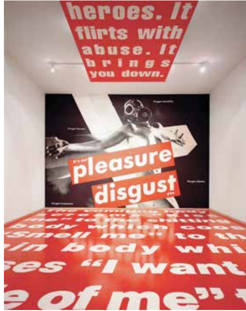
Görsel 8. Barbara Kruger, "Untitled (It's our pleasure to disgust you)", Installation view, 1991, Mary Boone Gallery, New York