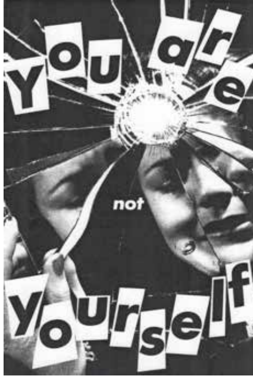
Görsel 7. Barbara Kruger, "Untitled (You're not yourself/Sen kendin değilsin)", 27.3 x 18.1 cm, Photograph and type on paper, 1981, Mary Boone Gallery, New York

You Are Not Yourself (Sen Kendin Değilsin) ” ifadelerinin yer aldığı çalışma (Görsel 7), gene sanatta feminist hareket kapsamında değerlendirilebilecek bir yaratımdır. Afiş niteliği taşıyan çalışmada iletilmek istenen mesaj izleyiciye doğrudan sözcükler aracılığıyla gönderilmekte ve kadın figürü üzerinden toplumun tüm kadın bilincine duyurulmaktadır. “Sen Kendin Değilsin” söylemiyle aktarılmak istenen, kadın imajının ona karşıt cins ve toplumsal düzen tarafından yüklenen bir anlayış olduğu, özgür ve eşitlikçi bir toplum için Hegel diyalektiğinin karşıtların savaşı ve özbilinç durumuna gelme halinin kadın tarafından bilinçli olarak sezilmesi ve yaşanması gereken bir eylem olduğudur. “... her nasılsa baştan beri var olan, sabit, dolayısıyla en azından tarihin belli bir noktasında bağlamıyla ilgi kurulmaksızın gün yüzüne çıkarılabilecek bir kadınlığın izinin sürülmesi”nin gerekliliği Kruger’in incelenen çalışmasında da göstergeler arasından temsil edilen gerçekliktir (Peterson ve Mathews, 2008, s. 69). Bu gerçeklik çalışmanın dilsel göstergeleri ile aktarıldığı kadar görselin parçalanmışlığı, yapısöküm yaklaşımı bakımından da dile getirilmektedir.