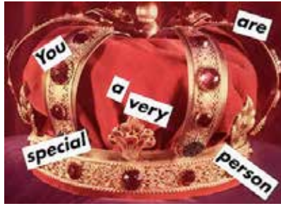
Görsel 1. Barbara Kruger, "Untitled (You are a very special person)", 235.59 x 320.04 cm, Photographic silkscreen on vinyl, 1995, The Broad, Los Angeles

Kruger'in "You Are a Very Special Person" isimli çalışmasında (Görsel 1); bir kral tacı temsil edilmiştir ve bu temsille özel olmak durumu arasında ilişki kurulmuştur. Selmanpakoğlu'na göre; (2015, s. 516). "... Kral olmanın ya da herhangi bir taç sahibi olmanın bizi özel yapması, dahası birşey yapması arasındaki ilişkidir buradaki Temsil edilen gerçeklik kadın bilincine gönderme yaparken, kral tacı ile erkek imgesi vurgulanmış ve paradoksal bir yaklaşım elde edilmiştir. Kruger'in çalışması, erkek egemen bir toplumda metalaştırılan, ötekileştirilen, özbilincinin farkında olması 'kral' ya da diğerleri tarafından engellenen kadın bilincine yapılan bir müdahaledir.