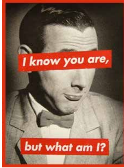
Görsel 4. Barbara Kruger, “Untitled (I know you are, but what am I? / Kim Olduğunu Biliyorum, Ama Ben Kimim?)”, 45.72 x 60.96, Silkscreen on vinyl, 1988

Owens’a göre Kruger; “Your/My ya da diğer çalışmalarında kullandığı I/You gibi dile ait temsilleri” özneyi değiştirmek için kullanmıştır” (Owens, 2001, s. 236-237’den aktaran Kozlu, 2009, s. 12). Yani ben ve öteki, kadınlar ve erkekler, efendi ile köle ilişkisine gönderme yaparak, böyle bir ilişkinin ve diğeri üzerinde üstünlük kurmaya çalışan insan figürünün ya da toplumsal yapılar ve sistem dayatmalarının yalnızca bir kurgudan ibaret olduğunu, bireyin özgür olduğunu ve özgür olduğunu bildiği halde ona dayatılan toplumsal rolleri yaşamak zorunda olmasına nedenler bulmak yerine, özne konumuna gelebilmek için kendi varoluşsal gerçekliğinin farkına varmasının gerekliliğini temsil etmektedir. Özüdoğru sanatta feminist hareketi tanımlarken feminist sanatın; “sınırlarını erkeklerin koyduğu ve kaidelerini erkeklerin belirlediği bir sanat dünyasında kadın temsillerinin yarattığı stereotipleri” sorguladığını belirtmiştir (Özüdoğru, 2010, s. 114). Barbara Kruger’in de kadına dair ortaya koyduğu çalışmalar bu kadın algısını rahatsız edici bir gerçekliğe taşıyarak temsil etmektedir. Gouma-Peterson ve Mathews’in ifade ettiği gibi; (2008, s. 37). “Temsil, önceden belirlenmiş toplumsal cinsiyet kavramlarını yeniden sunarak farklılığı inşa eder; bu kavramlar, tüm kurumlarımızı şekillendirir ve ideolojimizin ve inanç sistemimizin temelinde yer alır. Aynı durum erkek ve kadın kimliği hakkındaki kültürel tanımlarımız için de geçerlidir”.