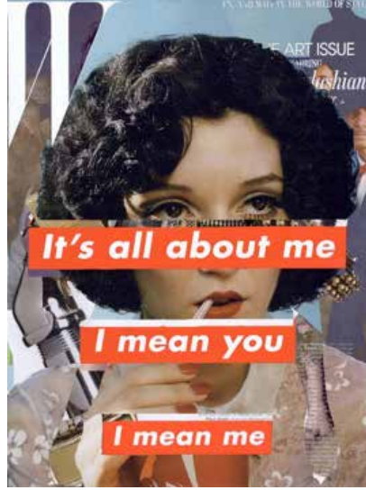
Görsel 6. Barbara Kruger, “Untitled (It’s all about me / I mean you/ I mean me / A world of vanity)”, 1992

boyunca bastırılan ‘ben’ deme özgürlüğüne ve özbilincine sahip olmalı ve böylece karşıt cins / öteki / efendi ile savaşı içerisine girerek, kendisini bir özbilinç olarak var etmeli, efendi karşısında üstünlük elde etmeli ya da efendinin onun varlığını tanımasını sağlamalıdır. Bu bakımdan Kruger’in bu çalışmada, feminist söylemin iki farklı kuşağını da temsil ettiği; hem kadın erkek eşitliğini, hem de kadının erkek karşısındaki üstünlüğünü betimlediği görülmektedir.