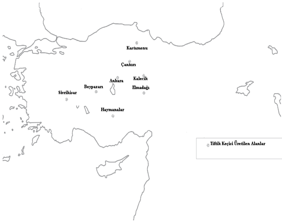
Harita 5: 18. yüzyılda Tiftik Keçisi Üreticiliği Yapan Alanlar

Ankara tüccarı gerek Anadolu coğrafyasında gerekse ülke toprakları dışında çeşitli ticarî faaliyetlerde bulunmuştur. Tiftik keçisinin kılından üretilen çok kaliteli bir kumaş olan sofun ticareti Ankara'ya çok değer kazandırmıştır. İmal edilen sof ve şaliler yerli ve yabancı tüccarlar tarafından İstanbul, Bursa, Şam, Halep gibi iç piyasada pazarlanırken Hollanda, İngiltere, Fransa ve diğer Avrupa ülkelerine de ihraç ediliyordu.