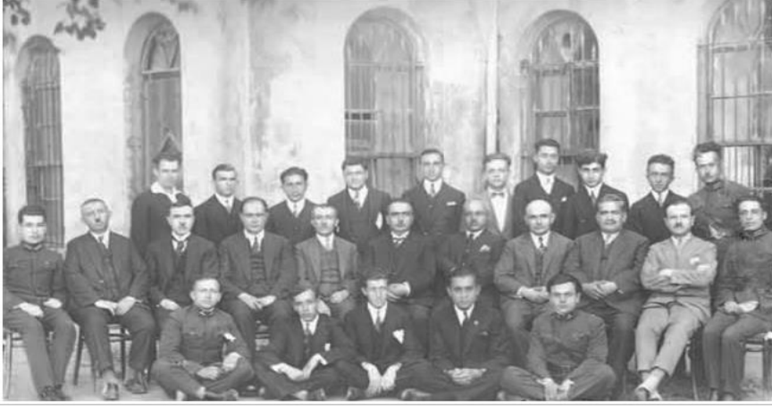
Resim 3. Yüksek Baytar Mektebi öğretim kadrosu ve öğrencileri (1928)