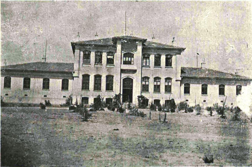
Resim 4. İstanbul Pendik'te 1914'te açılan Bakteriyojihaneye-i Baytari (sonraki adıyla Baytari Bakteriyoloji Enstitüsü)