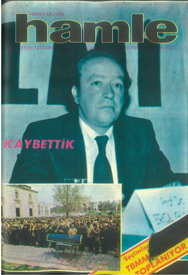
Resim 1 : Hamle Dergisi , ölümü vesilesiyle Prof. Dr. Erol Güngör'ün bir fotoğrafını 17. sayısının kapağı yapmıştır.