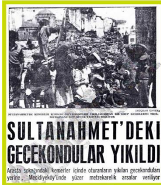
SULTANAHMET'DEKİ GECEKONDULAR YIKILDI Arasta sokağındaki kemerlerin içine oturanların yıkılan gecekonduları yerine, Mecidiyeköyünde yüzler metrekarelik arsalar veriliyor

1940'lı yılların gecekondu haberlerinde gecekondu alanlarında yaygınlaşan hastalıklar, karakol gibi temel hizmetlerden kaynaklı eksikliklerden bahsedilirken diğer taraftan “Gecekondulara dair verilen kat'i karar” (29 Ağustos 1948-Cumhuriyet Gazetesi) başlıklı haberde bu tarihten sonra gecekondu yapılmasına kesinlikle izin verilmeyeceği; bunu gerçekleştirebilmek için Kaymakamlığı'nın elindeki polis ve jandarmaya takviye yapılacağı bilgisi verilmektedir. Bir taraftan gecekondu alanlarına ve orada yaşayan göçmenlere ilişkin bilgiler sunulurken diğer taraftan gecekondu yapımının önüne geçilmeye de çalışılmaktadır.