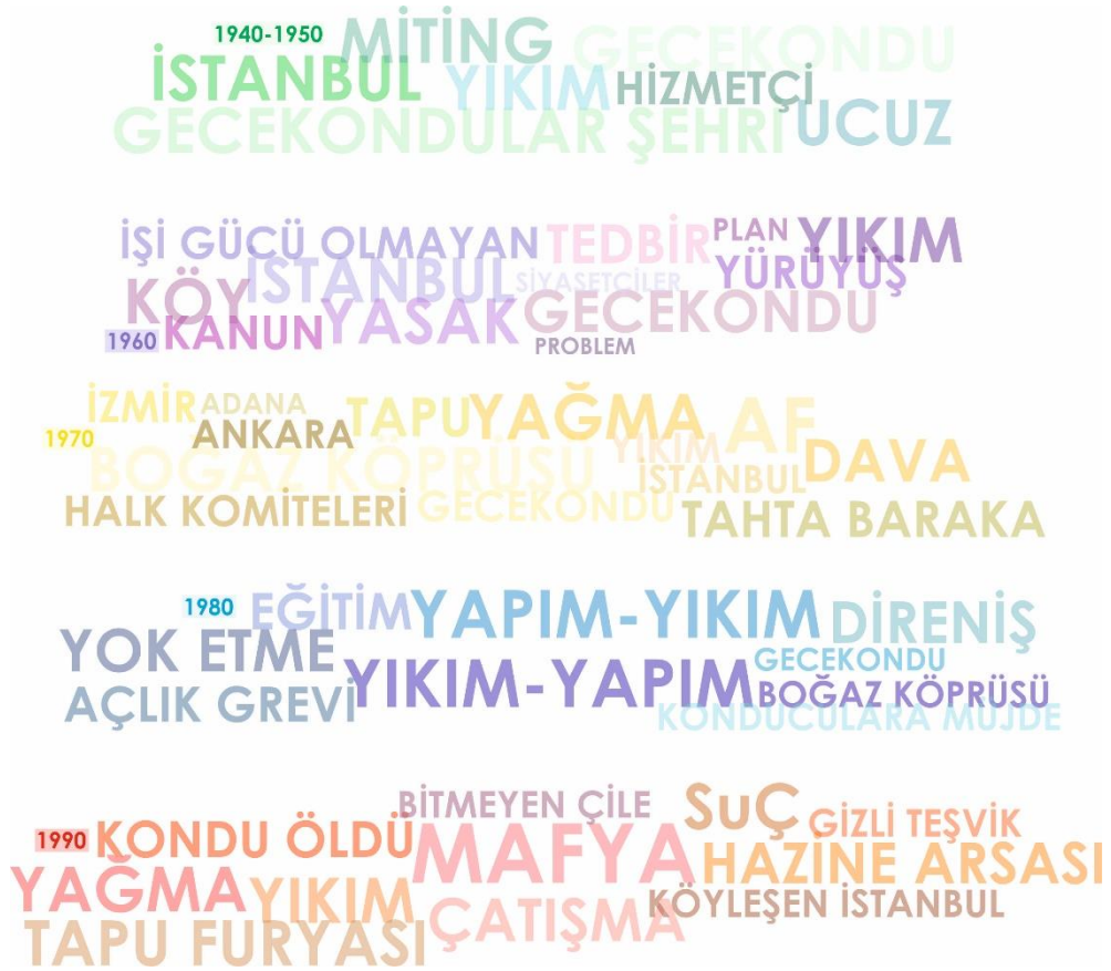
Şekil 6. Göç ve gecekondu haberlerinde sıklıkla kullanıldığı tespit edilen kelimelerden oluşan bir kolaj çalışması

Değerlendirmelerde izlenen biçimde, ilk dönemlerde yapılaşma şekline ve süresine bağlı olarak “gece kondu” ve “kondu”; sonraki dönemlerde barınma ihtiyacının karşılığı olabilecek “geçimkondu” gibi tabirlerle ele alınmış olan yapılanmalar, 1990’lı yıllara gelindiğinde, af yasaları ile ilişkili olarak “seçimkondu” ve değişen fiziksel görünümleri temelinde “apartkondu” kelimeleri ile değişen anlatımlar içerisinde yer almışlardır. Söz konusu yapılanmalar ve bu bağlamda “gecekondu” ortaya çıkmasına neden olan gelişmelerle değerlendirilmek yerine, yaşanan tüm olumsuzlukların kaynağı olarak gösterilmişlerdir. Gecekondulunun ayrıştırıcı ve suçlayıcı haber dünyasına aktarıldığı böyle bir ortam, bu alanların giderek kentsel müdahalelere ortadan kaldırılması için bir meşruiyet zemini de yaratmıştır.