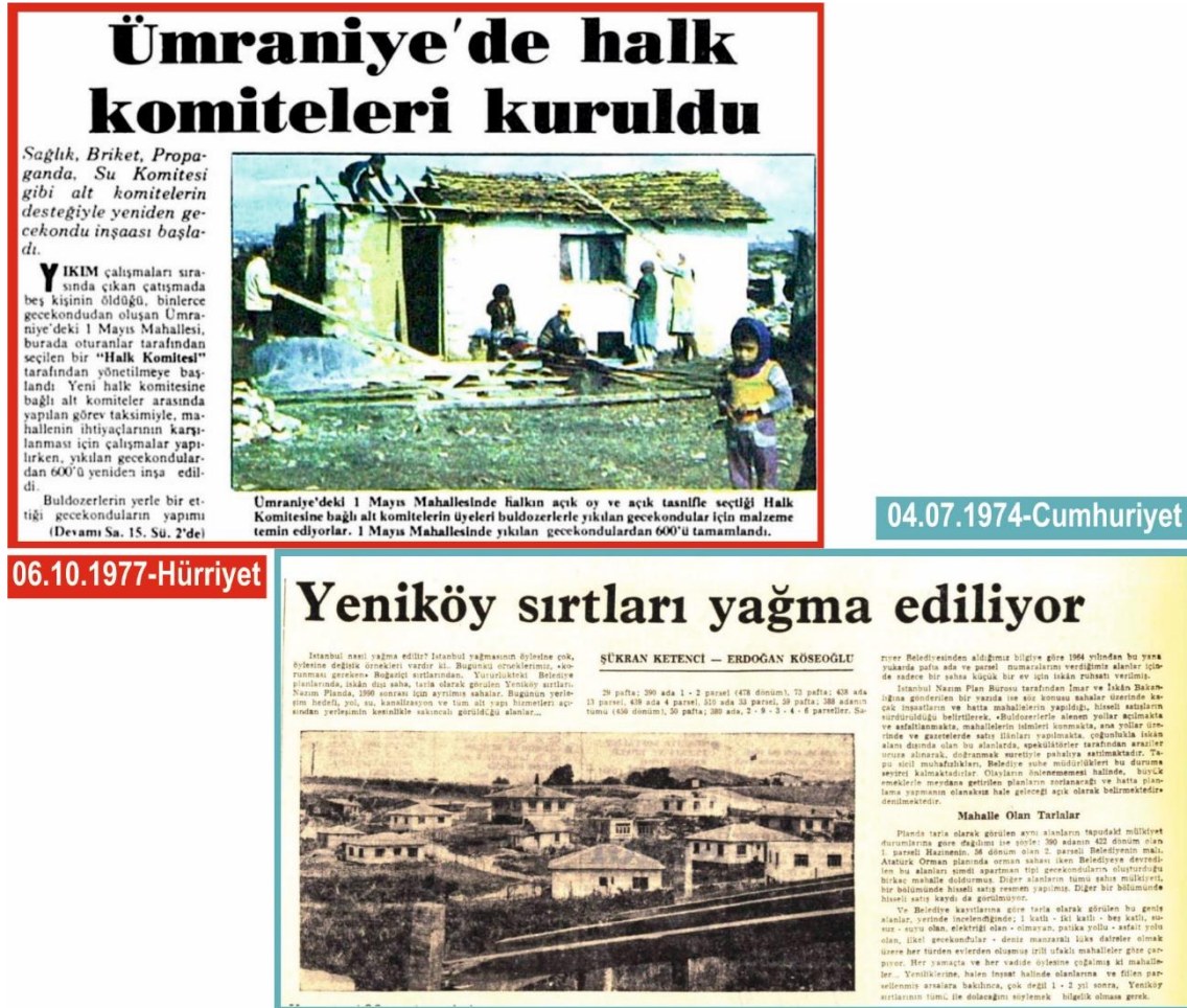
Şekil 3. 1970'li yıllar haberlerinden örnekler (URL-7, URL-8)

Gecekondu ve gecekonduculular 1970'li yıllarda sağlıksız yaşam koşulları ile birlikte gerçek ve potansiyel suç odakları olarak görülmüşlerdir (Aksoy ve Güzey Kocataş, 2017: 276). Sorunların kaynağı yerine şartların mağduru olarak tanımlanmaya başlayan gecekondu bu dönemde kentli tarafından sosyal ve kültürel boyutta kabul görmeyen bir topluluk olarak karşımıza çıkmaktadır. Gecekonduluların yaşadıkları bölgeler büyük hizmet ve altyapı sorunları yaşamaktadır. Dönemin siyasi ortamı içerisinde kurtarılmış bölge/mahalleler ortaya çıkmış; var olan düzenle bütünleşmek yerine var olanı kendi çıkarları doğrultusunda değiştirmeye çalışmıştır. Bu da onu "sakıncalı öteki"ye dönüştürmüştür (Erman, 2004). Bu dönemde üretilen konutlar barınma amacını aşarak bir ekonomi yaratma beklentisinin araçları haline gelmişlerdir. Kentlerin büyüme süreci içerisinde konumları nedeniyle değer kazanan gecekondu bölgeleri büyük müteahhitlerin ve sermayedarların ilgi alanına girmiş (Yıldız, 2008, 78) bu süreçte şekillenen yeni paylaşım ortamında gecekondu da kendine uygun stratejileri üretmeye başlamıştır.