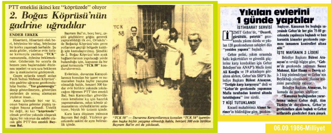
Şekil 4. 1980’li yıllar haberlerinden örnekler (URL-9, URL-10)

1980 sonrasında değişen kent politikaları ile bunun ortaya çıkardığı kentsel müdahaleler, olumsuzluk üzerine kurgulanan gecekondu algısı, mekansal ayrışma ve kentsel dönüşüm baskısı gecekonducuları etkilemiştir. Bu da sözkonusu alanlarda yaşayanları güçlü dayanışma ağları oluşturmak ve sayıca çeşitlendirmek konusunda motive etmiştir (Yalçınan vd., 2014: 218). “ Belki yıkmazlar...“Önde yapım...Arkada yıkım...” ”(25 Ağustos 1984-Cumhuriyet Gazetesi), “ Yıkılan evlerini 1 günde yaptılar ” (06 Eylül 1986-Milliyet Gazetesi), “ Evi yıkılan gecekonducu açlık grevinde ” (06 Temmuz 1987-Cumhuriyet Gazetesi) gibi haberlerle yıkıma hemen yenisini yapma veya grev gibi eylemlerle karşı çıkış ifade edilmektedir. Ayrıca bu dönem kadınların da ön plana çıkmaya başladığı bir dönemdir. Geleneksel algıdaki şalvarlı, başı tülbentle örtülü, kapısının önünde komşularıyla birlikte oturup örgü ören gecekondu kadını ögesinin yerini bir “özne” olarak araştırmalara konu edilen kadın almıştır (Erman, 2004). Kadınların bu alanlara ilişkin haberlerde de öne çıktığı görülmektedir. 05 Eylül 1986 (Milliyet Gazetesi) tarihli “ Kadınların gecekondu yıkımına direnişi ” haberinde durum “... Düne kadar 300 gecekondu yıkıldığı Beylikdağı'nda, kadınların çoğunlukta olduğu dükkân direnişi, dozerleri durdurdu... ” şeklinde verilmiştir.