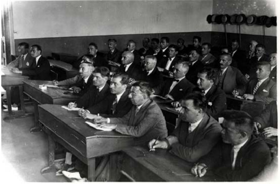
Ek: 7. Millet Mekteplerince Erkeklerle Açılan Kurslar.