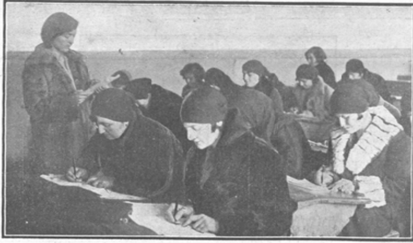
MİLLET MEKTEPLERİNDE HANIMLARIMIZ OKUYOR

MİLLET MEKTEPLERİ 1 Teşrinisanide Açılıyor