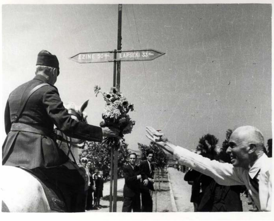
TİTE: K 8 G 81 B 81001