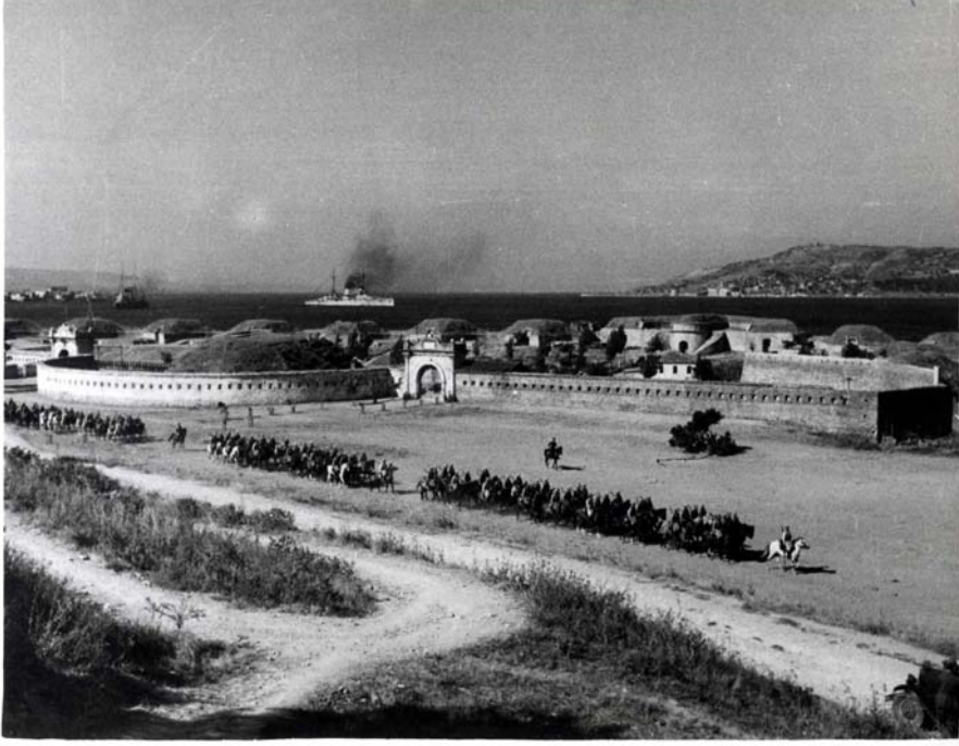
TİTE: K 8 G 81 B 81-1001