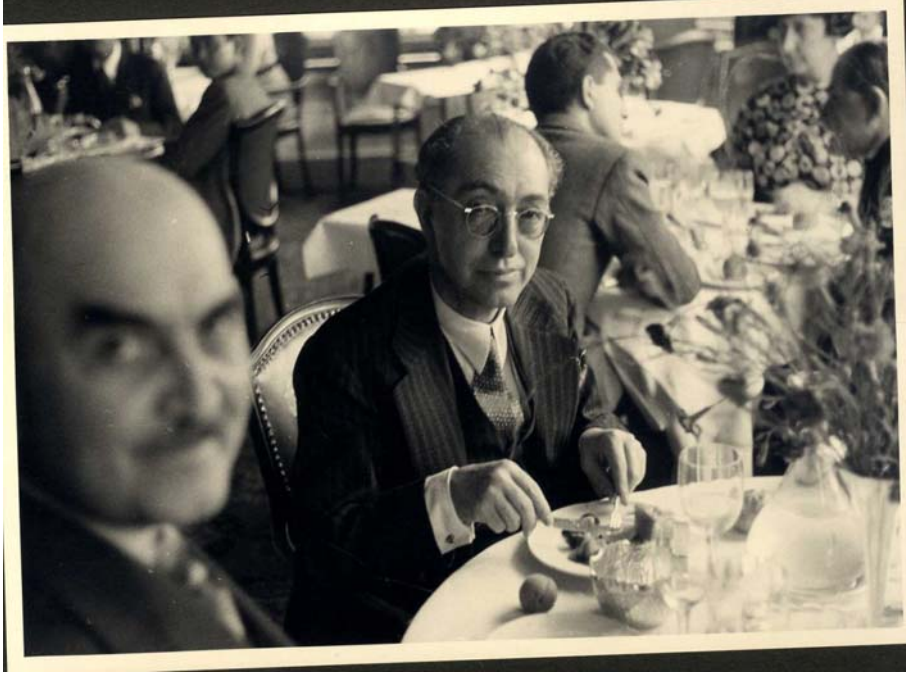
Hariciye Vekili Dr. Tefik Rüştü Aras (Gözlüklü)