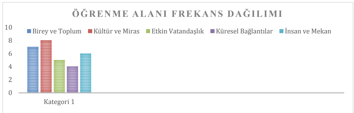
Grafik 5. Sosyal ağların ön plana çıkardığı öğrenme alanı frekans dağılımı