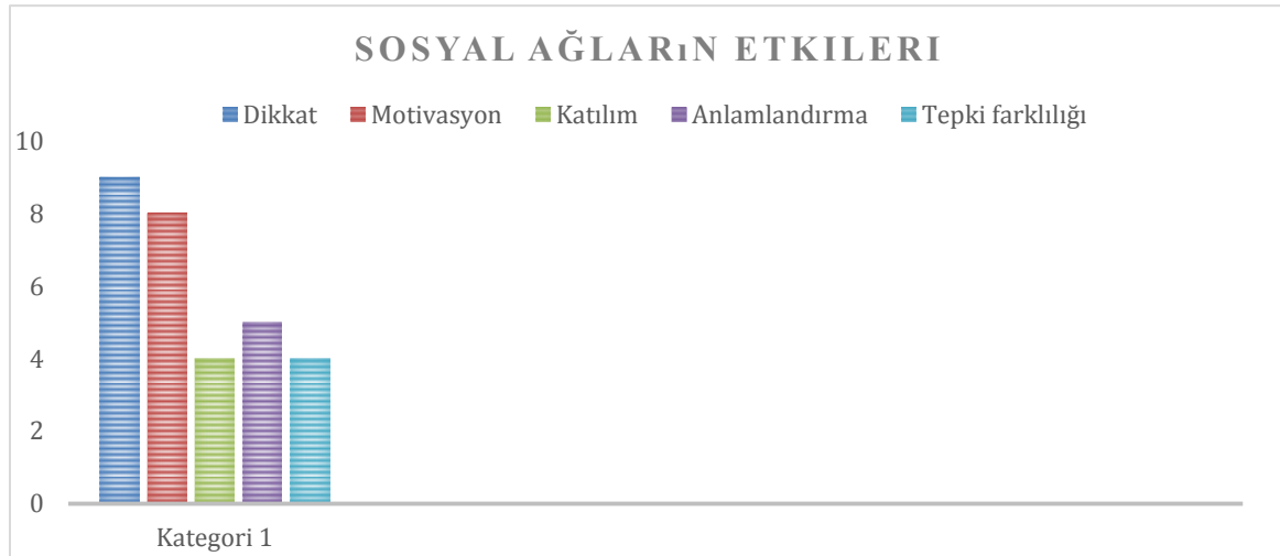
Grafik 4. Sosyal ağların öğrenci üzerindeki etkilerine ilişkin tematik frekans dağılımı

Yarı yapılandırılmış görüşme formunda yer alan “Sosyal bilgiler derslerinde sosyal ağlardan yararlanılmasının öğrenci üzerindeki etkileri sizce nelerdir?” şeklindeki soruya sosyal bilgiler öğretmenlerinin vermiş oldukları yanıtlar içerik analizine tabi tutularak elde edilen alt temalar ve frekans dağılımı tablo 2 ve grafik 4’de verilmiştir. Bu tablo ve grafiğe bakıldığında çalışma grubunu oluşturan sosyal bilgiler öğretmenlerinin konuya ilişkin farklı algılara sahip oldukları ortaya çıkmıştır. Çalışma grubunu oluşturan sosyal bilgiler öğretmenlerinin yarı yapılandırılmış görüşme formunda yer alan bu soruya ilişkin örnek görüşler aşağıda verilmiştir.