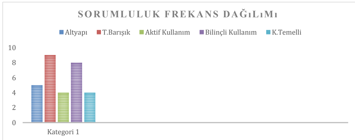
Grafik 6. Sosyal ağların sorumluluk frekans dağılımı