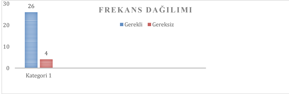
Grafik 3. Sosyal bilgilerde sosyal ağların kullanım gerekliliğine ilişkin frekans dağılımı

Sosyal bilgiler dersinde sosyal ağların kullanımının gerekliliğine ilişkin bulguların yer aldığı tablo 1'e ve bulguların frekans dağılımını gösteren grafik 3'e bakıldığında çalışma grubu üyelerinin farklılaştığı görülmektedir. Bu farklılaşmanın net bir belirginlik göstermemesi, çalışma grubu üyelerinin bu konuya bakışlarındaki homojen algılarından kaynaklandığı söylenebilir. Sosyal ağların sosyal bilgilerde kullanım gerekliliğine ilişkin çalışma grubu üyelerinin görüş örneklerinde aşağıda verilmiştir.