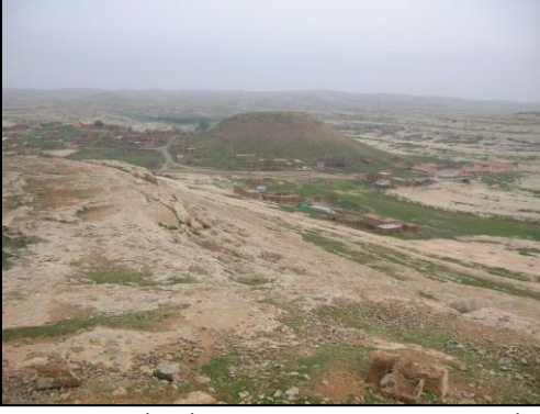
Resim 1. Soğmatar Kült Alanının ve Höyüğünün Batıdan Görünümü.