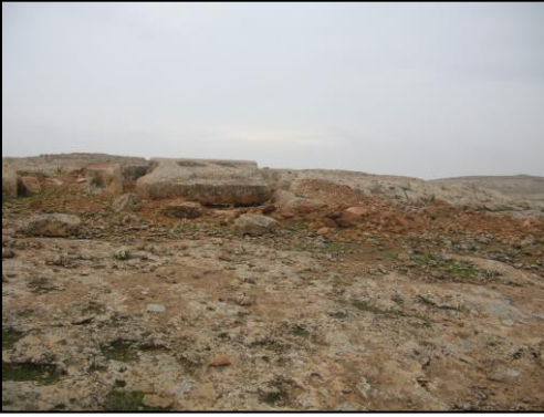
Resim 2. Taş Ocağının ve Aslan Kabartma Taslağının Doğudan Görünümü.