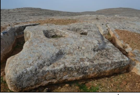
Resim 4. Aslan Kabartma Taşlağının Taşocağı İçinden Görünümü.