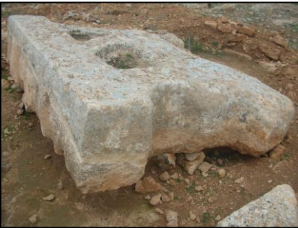
Resim 3. Aslan Kabartma Taslağının Yandan Görünümü.