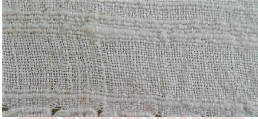
Fotoğraf 4. Peşkir dolamalarında, bezayağı dokuma tekniği kullanılmıştır (Küçükkurt, 2017).

Yörenin peşkir dolamalarında 1 cm düşen çözgü ve atkı sayısı; çözgü sayısı: 22-atkı sayısı:18, çözgü sayısı: 20-atkı sayısı:16, çözgü sayısı: 17-atkı sayısı:17 arasında tespit edilmiştir. Boyutları ise; 40cmx600cm, 38cmx600cm, 37cmx620cm, 43cmx630cm'dir. Genellikle meydan sofralarında kullanılacağı için, 12 kişinin aynı anda dizlerini örtecek boyutlarda dokunmuştur.