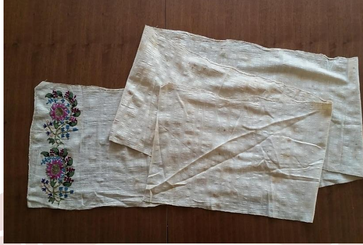
Fotoğraf 10. Remziye Gülenay Yalçinkaya'ya ait peşkir dolaması (Küçük Kurt, 2018).