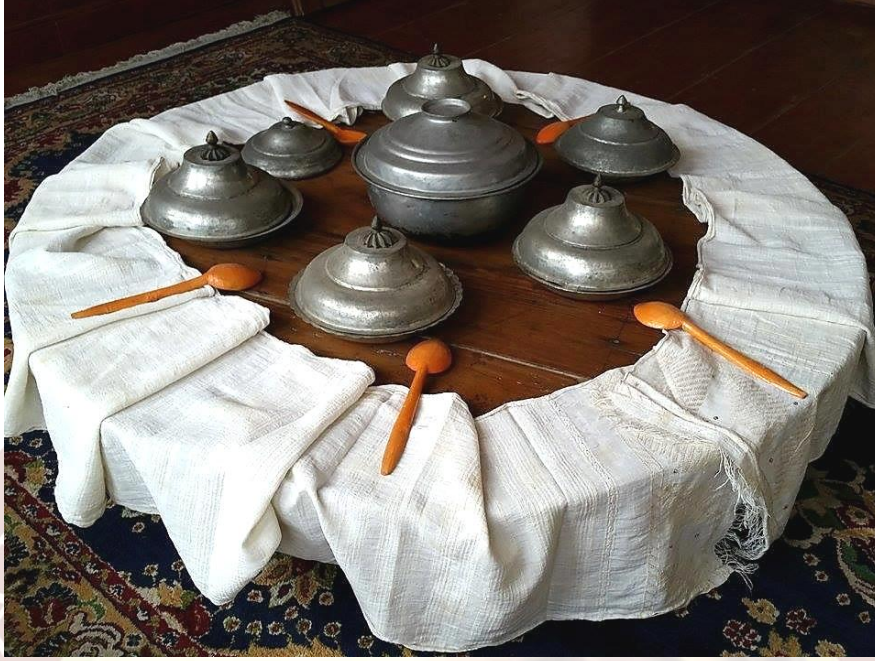
Fotoğraf 3. Peşkir dolamalarının sofraya oturulmadan önce hazırlanması (Küçük Kurt, 2017).