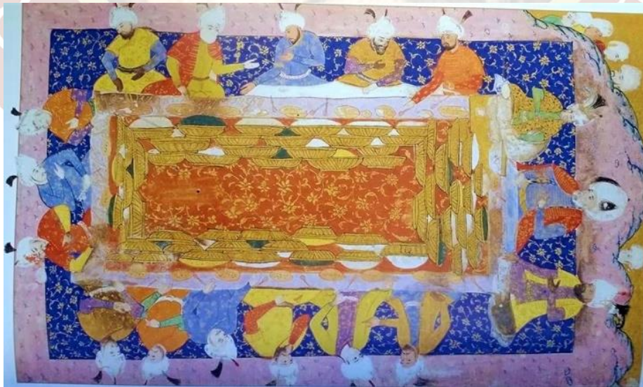
Fotoğraf 1. Ferhat Paşa'nın Erzurum'da Şehzade Haydar'a ziyafet vermesi. Misafirlerin dizlerinde peşkir dolaması yer almaktadır. Kitap-ı Gencine-i Feth-i Gence, TSM R1296, y. 48b (Oberling-Smith, 2001: 84).

Bazı yazılı kaynaklarda Türk kültüründe peşkirin kullanımına değinilmiştir. Bunlar arasında 1553 yılında Anadolu’yu ziyaret eden Hans Dernschwam’da bulunmaktadır. Dernschwam seyahatinde aldığı notlarda peşkir dolamalarına yer vermiştir “Türkler yemeği yerde oturarak yerler. Yerde bir örtü veya halı serilidir. Bunun üzerine çepeçevre otururlar. Masa kullanmazlar. Hali vakti yerinde olanlar yere bir sofraya yayarlar. Bu yuvarlak bir deridir. Üzerine tahta senit veya kalaylanmış bakır sini oturturlar. Bunun üzerine de 2 veya 3 kap yemek, ekmek, kaşık koyarlar. Masa örtüsü kullanmazlar. Ancak yemek bir ziyafet ise, dizler üzerine yayılan uzun yekpare bir örtü alırlar. Buna da peschkor (Peşkir) derler.” (Dernschwam, 1992: 173). (Bkz. Fotoğraf 1).