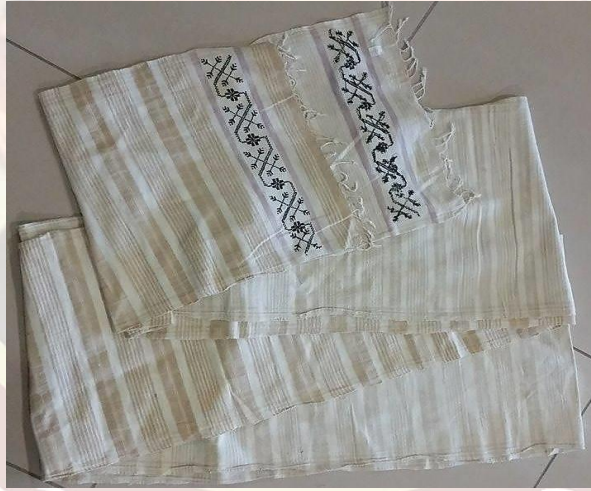
Fotoğraf 13. Afyonkarahisar Türk Anneler Derneği tarafından Afyon Kocatepe Üniversitesi'ne bağışlanan peşkir dolaması (Küçük Kurt, 2016).

Eserin durumu ve diğer özellikleri: Eser, Afyonkarahisar Türk Anneler Derneği tarafından Afyon Kocatepe Üniversitesi'ne bağışlanmıştır. El tezgahında açık kahve ve krem rengi çubuk halinde dokunan dolamanın iki ucuna dal ve çiçek motifleri çin iğnesi tekniği kullanılarak, bordo renkte işlenmiştir. Eser iyi durumdadır. Saçaklar bükülerek kısa bırakılmıştır.