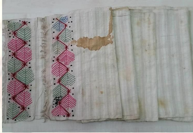
Fotoğraf 9. Şükran Hasçelikoğlu'na ait peşkir dolaması (Küçükkurt, 2016).