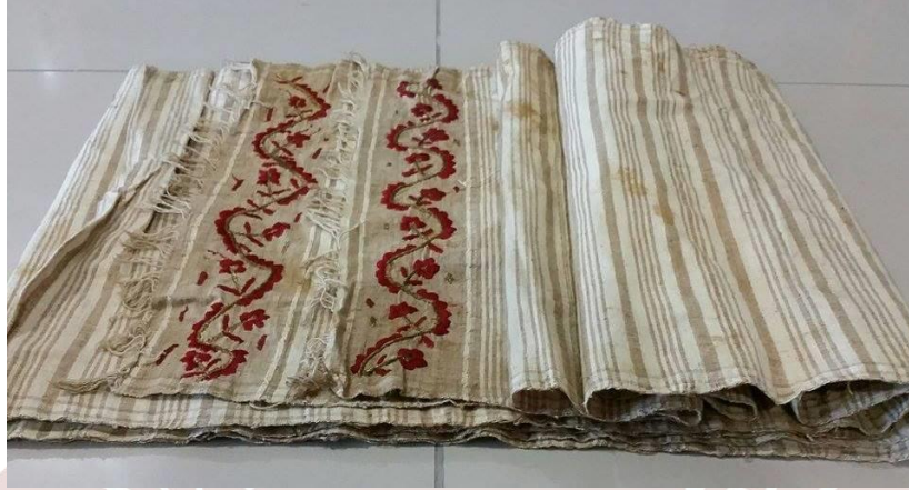
Fotoğraf 12. Afyonkarahisar Türk Anneler Derneği tarafından Afyon Kocatepe Üniversitesi'ne bağışlanan peşkir dolaması (Küçük Kurt, 2016).