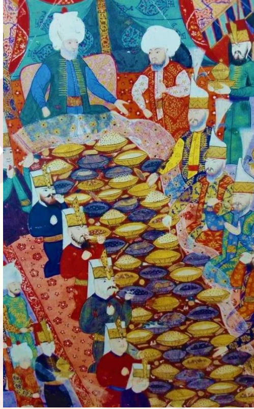
Fotoğraf 2. Lala Mustafa Paşa'nın Yeniçeri Ağalarına verdiği ziyafet. Misafirlerin dizlerinde işlemeli peşkir dolaması bulunmaktadır. Nusretname. 1584. TSM H 1365,34a. (Atasoy, 2000: 17).

Peşkir ve peşkir dolamaları Osmanlı sofralarının süsü ve vazgeçilmez unsuruydu. Lala Mustafa Paşa'nın 1587 yılında İran seferine çıkmadan önce Yeniçeri ağalarına verdiği ziyafeti tasvir eden Gelibolulu Ali'nin Nusretname'si'nde yer alan bir minyatürde, misafirlerinin dizlerinde işlemeli peşkir dolaması bulunmaktadır (Atasoy, 2000: 17). (Bkz. Fotoğraf 2).